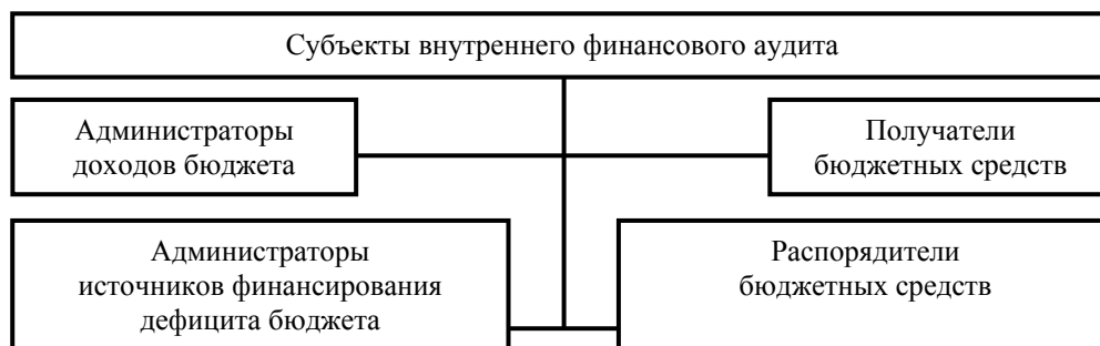
Рис. 1. Субъекты внутреннего финансового аудита

Субъекты внутреннего финансового аудита представлены на рис. 1.