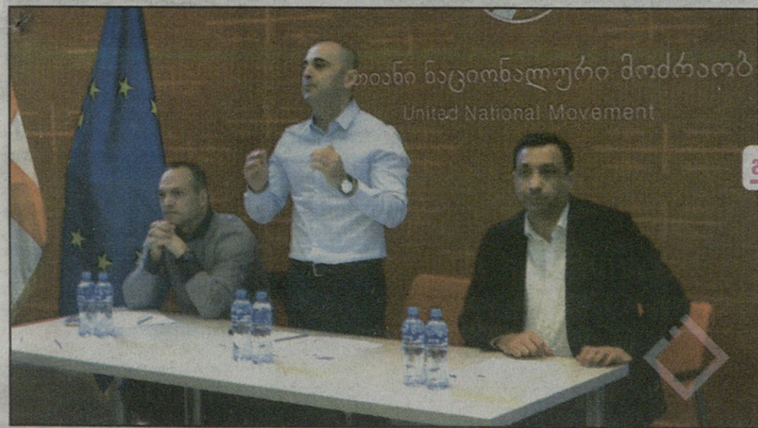
ივანი ნაციონალური მოძრაობა United National Movement