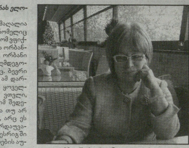
„ორბანის პოზიცია ძალიან მკაფიოდ ფორმულირდება, როგორც პოლიტიკური პროსტიტუცია!“

– სინამდვილეში, საქართველოში წინასასარჩევნო კამპანიას და „ოცნების“ პიარს, არა მოშე, არამედ „ეფესებ“ ატარებს. მოშე, უბრალოდ, არის იმის ტექნიკურად აღმსრულებელი, რა დაკვეთაც მოდის „ეფესებთან“. მე მესმის, რატომ შეაჩერეს მოშეზე არჩევანი, აქვთ პოლიტიკური გამოცდილება. თუმცა, ძველი ქართული ანდაზისა არ იყოს, ცოტა გადავაკეთოთ და მოშე ყოველთვის ხმებს ვერ მოიტანს. ყველაფერს აქვს თავისი შესაფერისი დრო და მოცემლობა, როდესაც ის კარგად მუშაობს. ახლა მგონია, რომ საქართველოში არ არის ის ვითარება, როდესაც მოშეს შეუძლია გადაწყვიტოს არჩევნების ბედი და იყოს ისეთივე წარმატებული „ოცნებისთვის“. ამ შემთხვევაში ბევრი სხვა ფაქტორი იმუშავებს.