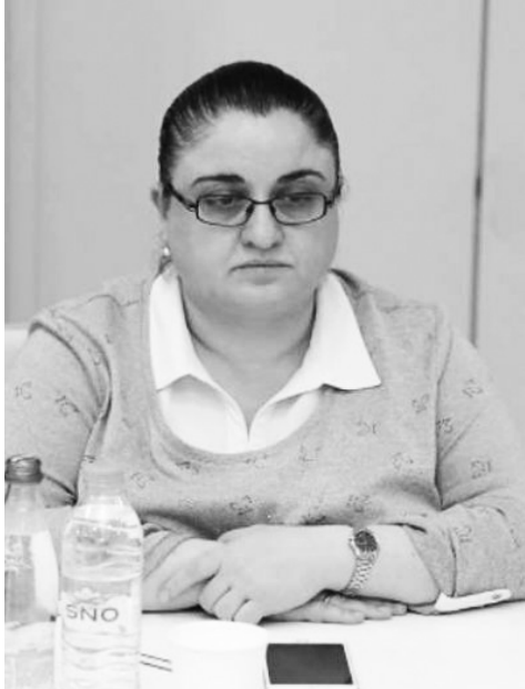
როდესაც ზომებს ვუყურებთ, დასკვნაში სრულიად ნორმალური ზომის ლიმფური კვანძებია აღწერილი.