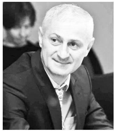
ირანისკენ, ჩინეთისკენ და არაღემოკრატული ქვეყნებისკენ სვლა.

დასავლური ინტეგრაციის პროცესის საბოლოო და რუსეთისკენ,