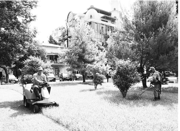
სავალი ბილიები დამუშავდა შერბილით. ახალსოფლის სანერგე-სასაბურე მეურნეობაში რეგულარულად მიმდინარეობს ყვავილების ჩითილების მოწესრიგისა და გადარგვის სამუშაოები, - ნათქვამია გავრცელებულ ინფორმაციაში.

ბათუმში სკვერების, პარკების, მწვანე სივრცეებისა და მრავალბინიანი საცხოვრებელი კორპუსების ეზოების მოწესრიგება მიმდინარეობს, პარალელურად კი რამდენიმე ლოკაციაზე სხვადასხვა სახის სამუშაოები ხორციელდება. ინფორმაციას გამწვანების სამსახური ავრცელებს. მათივე ცნობით, მიმდინარე კვირის განმავლობაში გოგებაშვილის, რუსთაველის, გამსახურდიას, ჩაიკოვსკის, ჭავჭავაძის, კომანძისა და ხიმშიაშვილის ქუჩებზე მოწესრიგდა პარკები, სკვერები, საყვავილე კლუმბები და წრიულები.