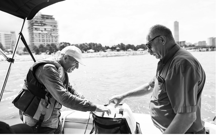
სუფთა ზღვის წყალი სარფი-კვარიათისა და მახინჯაურის მუვანე კონცხის ტერიტორიებზე დაფიქსირდა. კვლევებს საერთაშორისო აკრედიტაციის მქონე სსიპ ლაბორატორიული კვლევითი ცენტრი ატარებს შემდეგ მარცხენა ნაწილებზე: ნაწილის ჩხირის ჯგუფის ბაქტერიები, ლაქტოზადადებითი ნაწილის ჩხირები, ენტეროკოკი, კოლიფაგები, სალმონელას ბაქტერიები. სინჯების აღება ხდება მცურავი საშუალების გამოყენებით, ნაპირიდან 50 მეტრის რადიუსში. - ნათქვამია გავრცელებულ ინფორმაციაში.

აჭარის სოფლის მეურნეობის სამინისტროს ინფორმაციით, აღებული სინჯების კვლევის მიხედვით, შავი ზღვის წყლის ხარისხი სრულ თანხვედრაშია დასაშვებ ნორმებთან.