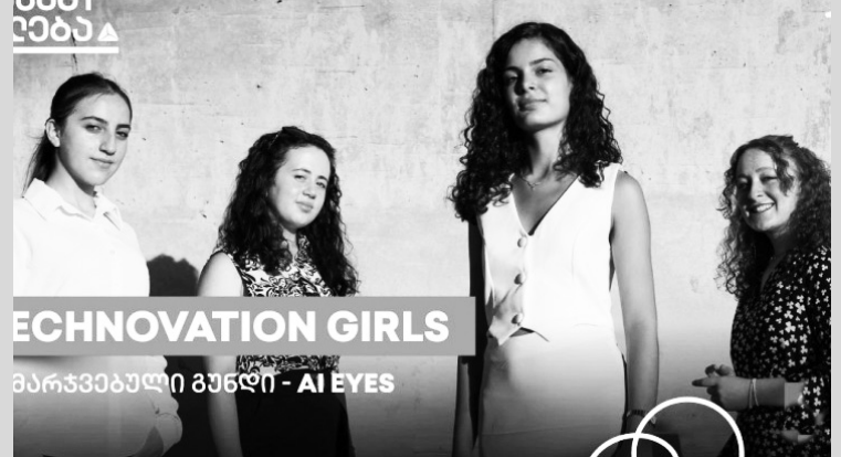
Technovation Girls SAKARTVELO 2024-ზე წარდგენილი პროექტებიდან. ადგილობრივმა ფორუმმა გამარჯვებული გუნდები გამოავლინა, რომლებიც საქართველოს სახელით საერთაშორისო კონკურსში მიიღებენ მონაწილეობას.

ელს“, - ამბობენ გოგონები. აპლიკაციას ასევე აქვს წიგნის კითხვის ფუნქცია - მომხმარებელი თავად ატვირთავს სასურველ წიგნებს, ჩაშენებული AI სისტემა კი მისთვის წაიკითხავს. ამ ეტაპზე აპლიკაცია ინგლისურ ენაზე სრულიად გამართულად ფუნქციონირებს. რაც შეეხება ქართულს, უკვე