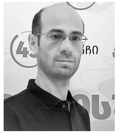
მედ ხალხის მხარდაჭერას ნიშნავდა.

ართ. ჩემი აზრით, მათი ჩამოსვლა არა მთავრობის მხარდაჭერას, არა-