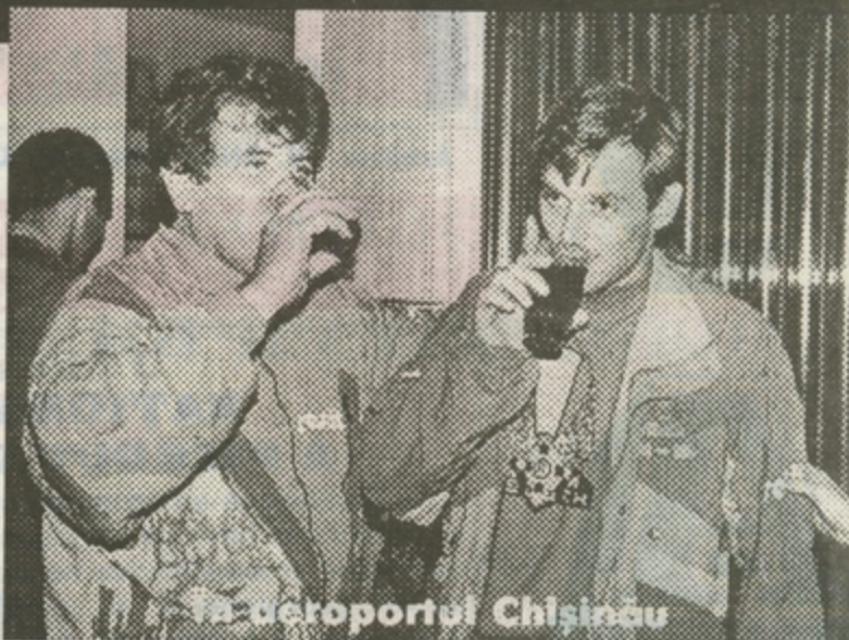
La aeroportul Chișinău