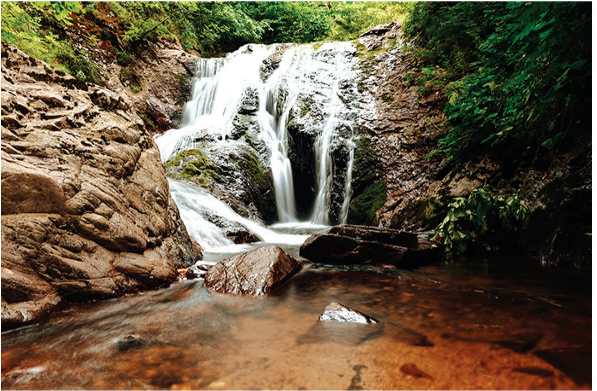
სოფელი გიჭნისი. ტაბაკლდე.