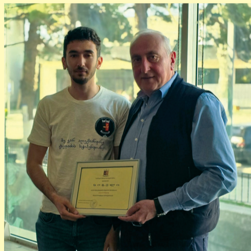
ფანოზიშვილთან ერთად ესწრებოდა...

ქვეპროგრამა გულისხმობს მაღალი აკადემიური მოსწრების მქონე სტუდენტებისთვის ფულადი ჯილდოთი წახალისებას, სტუდენტებში მოტივაციის ამაღლებას, განათლების ხელშეწყობასა და მოწვევადი ჯგუფების მხარდაჭერას.