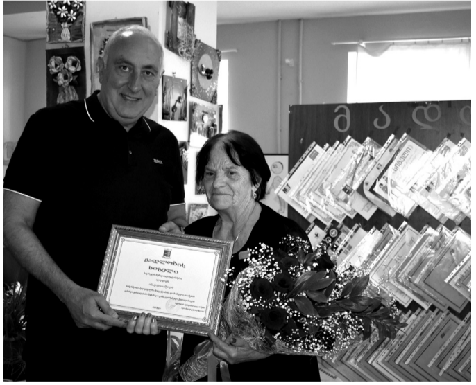
დასასრული მმ-5 ბებრღზე

მაღე ქნი ციციანო გადავიდა რაიონის განათლების რესურს-ცენტრის უფროსად და