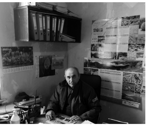
როგორც აღვნიშნეთ, ჩასატარებელია გარკვეული მცირე ხარისხის სამუშაოები და ჩვენი აზრით, ეს ტურისტული ბილიკები და თავშესაფრები მაის-ივნისში დაიწყებენ ფუნქციონირებას.

– ეს იქნება ტურისტების ტურისტული თავშესაფრებით უზრუნველყოფა და ასევე, მათ მივაწვდით საჭირო ინფორმაციებს ტურისტული ბილიკების მარშრუტებისა და მათთვის სხვა საინტერესო საკითხებზე. აქვე ვფიქრობთ, რომ გაიზრდება ტურისტების რაოდენობა და საჭირო გახდება საცხენოსნო ტურიზმის განვითარებაც, განხილვა მთისოვნა საოჯახო სასტუმროებზე, სასოფლო-სამეურნეო და კვების პროდუქტებზე. ყველაფერი ეს კი ხელს შეუწყობს მოსახლეობის დასაქმებასა და ადგილობრივი ბიზნესის განვითარებას, ამ ბიზნესში ჩართულთა შემოსავლების ზრდას და დამატებითი შემოსავლების მიღებას. ყველაფერი ეს კი ამ საქმისადმი ახლებურ, ნოვატორულ მიდგომას, ადგილობრივი მოსახლეობისაგან თანადგომასა და მხარდაჭერის გაძლიერებასაც მოითხოვს, რომელთა ცნობიერების ასამაღლებლად ჩვენი სამსახური პერიოდულად მიმართავს სხვადასხვა შემეცნებით ღონისძიებებს – ვატარებთ საუბრებს მუნიციპალიტეტის საჯარო სკოლებში მოსწავლე-ახალგაზრდობისათვის ვაწყობთ ეკოტურებს ჩვენს დაცულ ტერიტორიებში, ვუტარებთ აქციებს გარემოს დასუფთავებაზე, ვხვდებით ადგილობრივ მოსახლეობას და ვესაუბრებით გარემოს დაცვის მნიშვნელობასა და გარემოსდაცვითი კანონმდებლობის შესახებ. ერთი სიტყვით, თამამად შეიძლება იმის თქმა, რომ საგარეჯოში ეკოტურიზმის განვითარების პირველი ნაბიჯები უკვე გადაიდგა, რასაც, იმედია მალე ტურიზმის სხვა სახეობების განვითარებაც მოჰყვება და ჩვენი მუნიციპალიტეტი ასევე მალე გახდება საქართველოში ტურიზმის ერთ-ერთი საინტერესო და მიმზიდველი კერა.