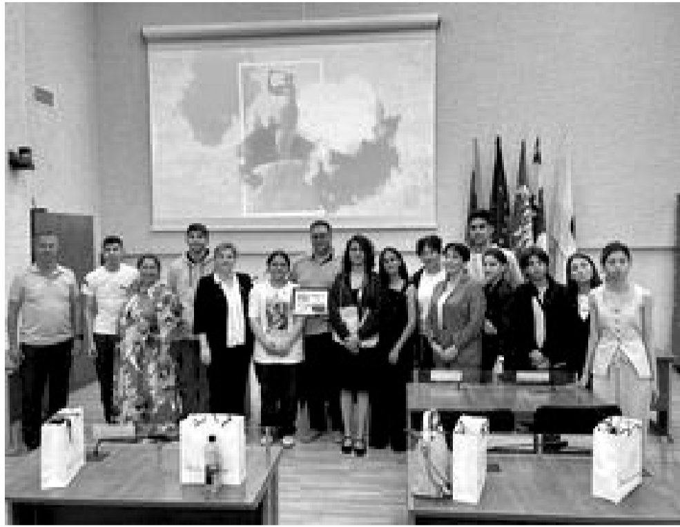
სტუმრად ქალაქის მერიამ

ვფიქრობ, ცოტა დაგვიგვიანდა კიდევ მკითხველისათვის სისხ გალაკტიონ ტაბიძის სახელობის ქალაქ ხაშურის #6 საჯარო სკოლისა და რადვილიშკოს ლიზდეიკოს გიმნაზიას შორის დაწყებული