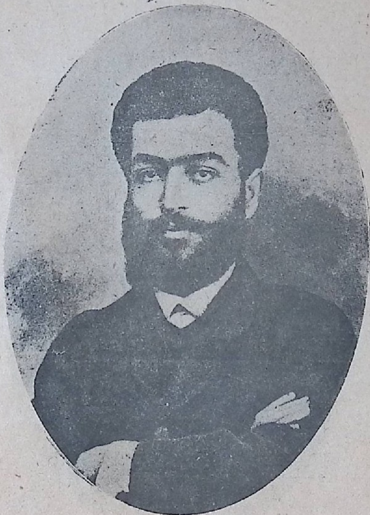
ს მ ე ს ხ