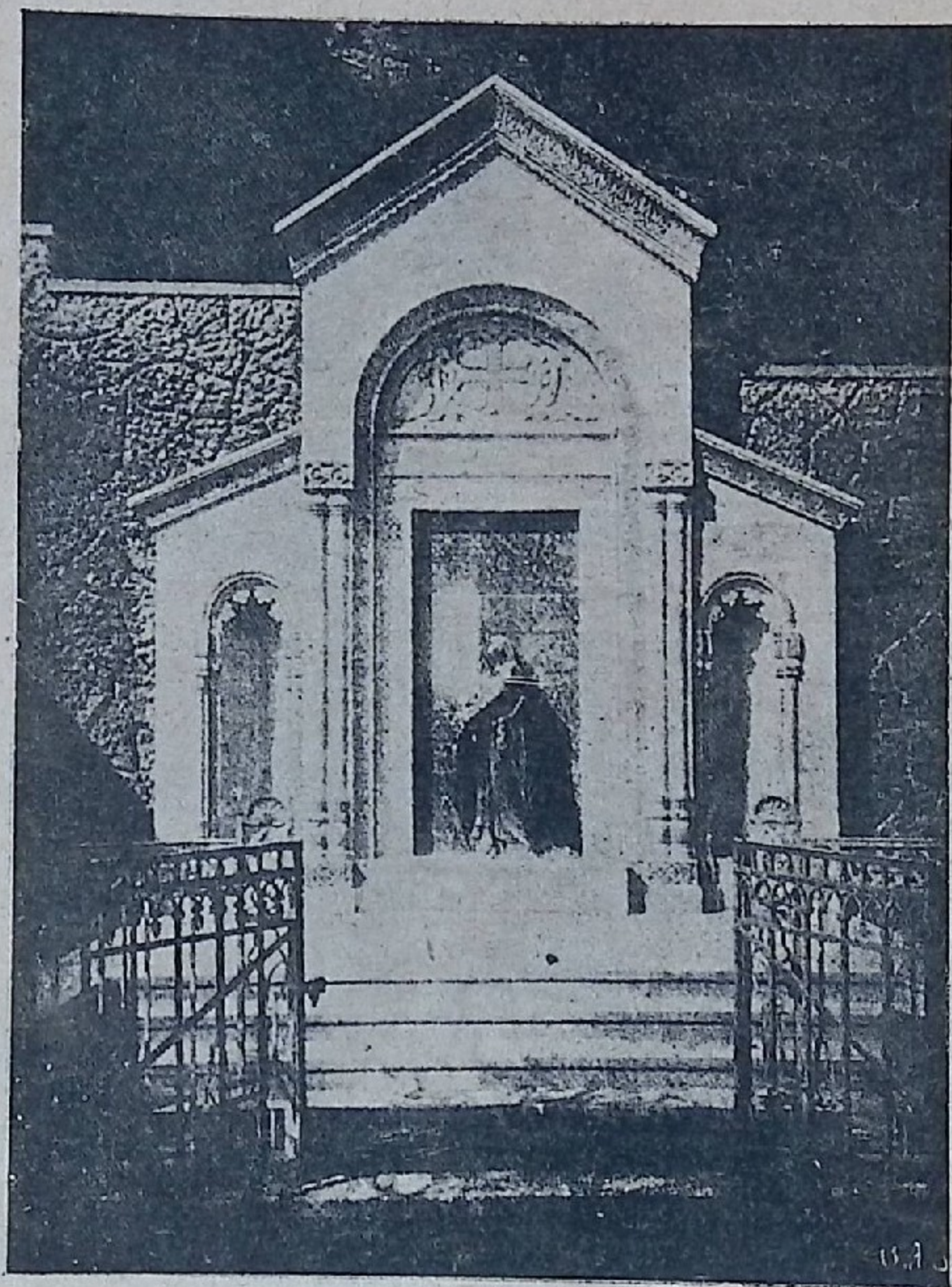
ილიას ძეგლი მამადავითზედ