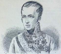
Фридрихъ Вильгельмъ IV.