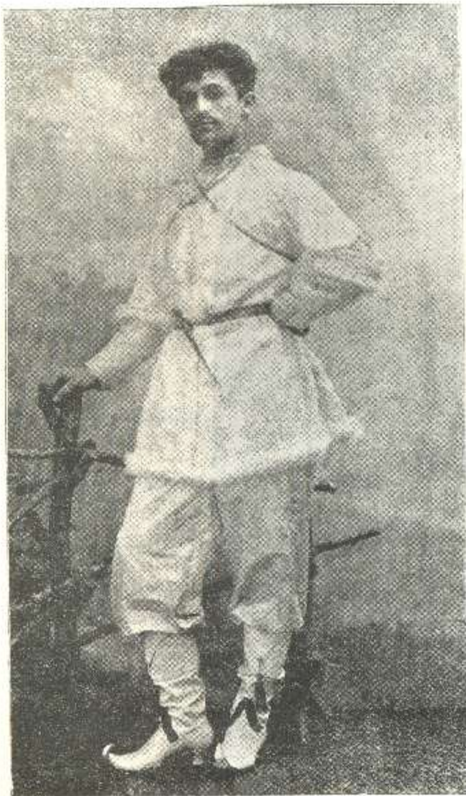
ირაკლი ჯაბადარი 1907 წ.

სამწუხაროდ ამ ამბავთან ერთად, ირაკლი ჯაბადარის ავადმყოფის ამბავიც მოგვივიდა. ამ ცოტახანში ჯაბადარი აპრობს ჩამოსვლას თბილისში.