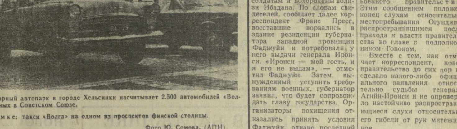
Таксомоторный автопарк в городе Хельсинки насчитывает 2.500 автомобилей «Волга», закупленных в Советском Союзе. На снимке: такси «Волга» на одном из проспектов финской столицы.

ХАНОИ, 3 августа. (ТАСС). За последние месяцы американские империалисты систематически нападают на системы дамб и ирригационные сооружения ДРВ, говорится в опубликованном здесь заявлении министерства полного хозяйства. Беспорядочные воздушные налеты американской авиации на ирригационные сооружения, указывается в заявлении, переданном агентством ВИА, предусматривают заранее разработанным планом американского правительства, имеющим целью вызвать наводнения и засуху, нарушить производство и поставку под угрозу жизни миллионов людей. Эти налеты являются вопиющим нарушением Женевских соглашений 1954 года по Вьетнаму и вызовом всему прогрессивному человечеству. Министерство полного хозяйства и электростанций ДРВ, указывается в заявлении, решительно осуждает бесчеловечные военные преступления правительства