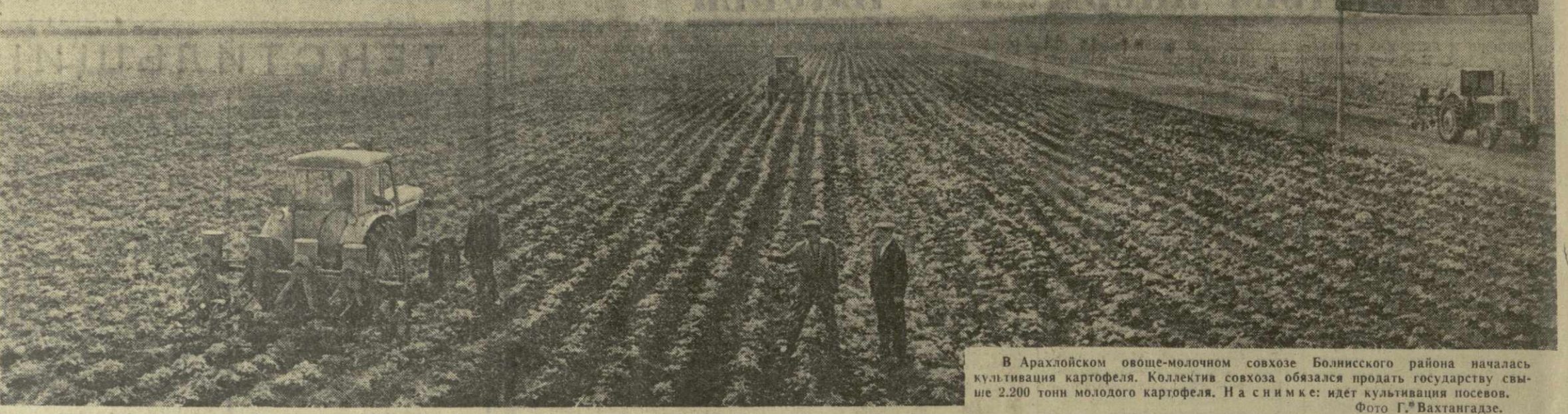
В Арахлейском овоще-молочном совхозе Болнисского района началась культивация картофеля. Коллектив совхоза обязался продать государству свыше 2.200 тонн молодого картофеля. На снимке: идет культивация посевов.

Г. КИКИЛАШВИЛИ, инструктор Лагодехского райкома партии.