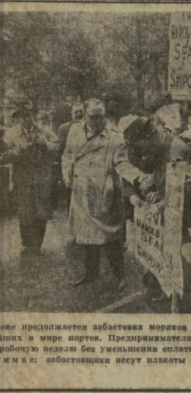
В Лондоне продолжается забастовка моряков торгового флота. Замерла жизнь в одном из крупнейших в мире портов. Предприниматели не соглашались на требования моряков сократить рабочую неделю без уменьшения оплаты. В порту скопилось несколько сот судов. На снимке: забастовщики несут плакаты с требованием сократить рабочую неделю.