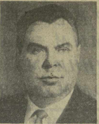
Н. В. Капитов, Секретарь ЦК КПСС