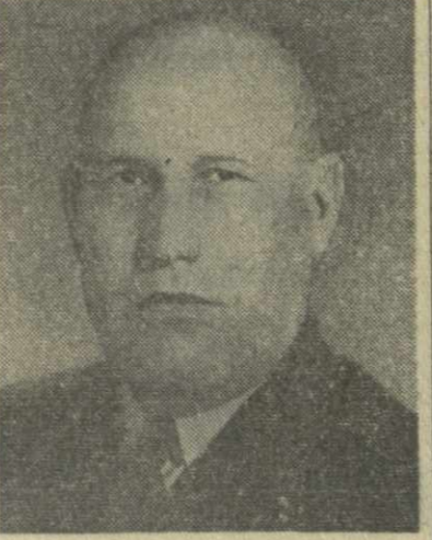
Г. Ф. Сизов, Председатель Центральной Ревизионной Комиссии КПСС