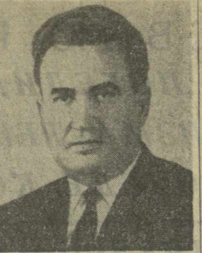
Ф. Д. Кулаков, Секретарь ЦК КПСС