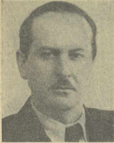
Б. Н. Пonomарев, Секретарь ЦК КПСС