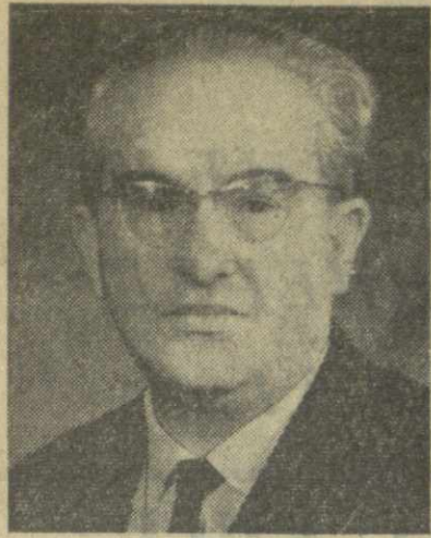
Ю. В. Андропов, Секретарь ЦК КПСС

Члены Центрального Комитета Коммунистической партии Советского Союза