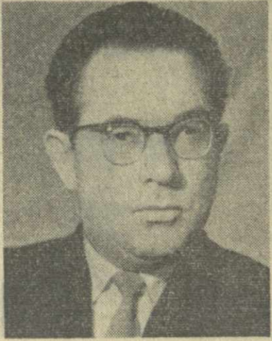
А. П. Рудаков, Секретарь ЦК КПСС