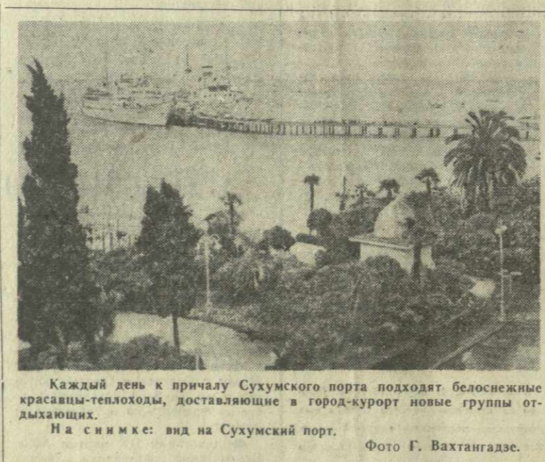
Каждый день к причалу Сухумского порта подходят белоснежные красавцы-теплоходы, доставляющие в город-курорт новые группы отдыхающих. На снимке: вид на Сухумский порт.

МОСКВА, 16. (Норр. ТАСС). На сцене Кремлевского Дворца съездов продолжается спектакль Тбилисского театра оперы и балета имени З. Палиашвили. Зрители встретили сегодня здесь с народным артистом СССР Вахтангом Чабукиани. Этот выдающийся мастер выступил как либретрист, постановщик и исполнитель главной роли в балетном спектакле «Отелло» (музыка А. Мачавариани).