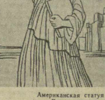
Американская статуя Свободы и ее «тень».