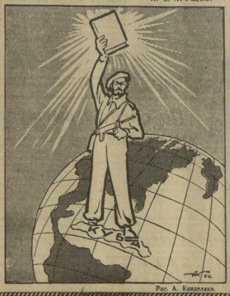
Рис. А. Канделаки.

Колхозы и совхозы Болонского территориального производственного управления выполнили годовую план продажи государству табачного сырья. При плане 1.115 тонн государству продано 1.123 тонны табачного сырья. Трудящиеся производственного управления обязались продать государству сверх плана 1.000 тонн табачного сырья. (ГрузТАГ).