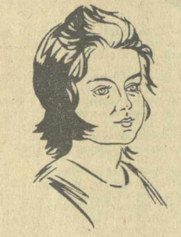
О. Лакс. Рис. Е. Махашвили.