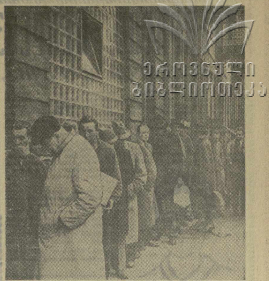
АМЕРИКАНСКАЯ ДЕЙСТВИТЕЛЬНОСТЬ. На снимке: очередь голодных за благотворительным обедом.