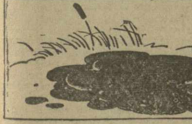
Рис. А. Канделак.