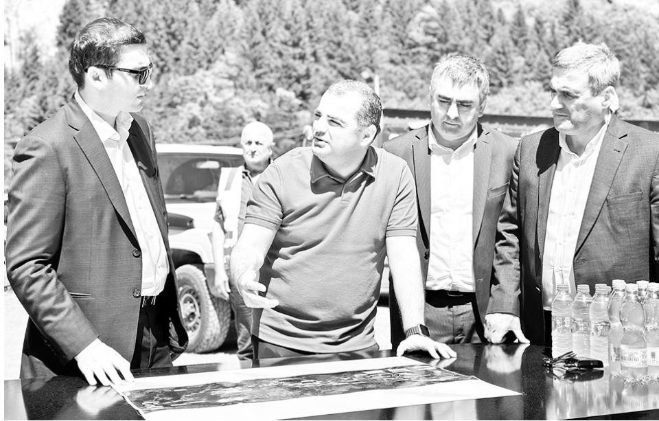
აღნიშნული საავტომობილო გზის რეაბილიტაცია-რეკონსტრუქციის შედეგად, მნიშვნელოვნად გაუმჯობესდება საგზაო მოძრაობის უსაფრთხოების ხარისხი. განახლებული

პროექტი ქუვეითის ფონის ფინანსური მხარდაჭერით და სახელმწიფო ბიუჯეტის დაფინანსებით ხორციელდება. ამ ეტაპზე ასფალტ-ბეტონის საფარი დაგებულია 21 კილომეტრზე, ხოლო დანარჩენ მონაკვეთებზე მიმდინარეობს მიწის ექსკავაციისა და საყრდენი კედლების მოწყობის სამუშაოები.