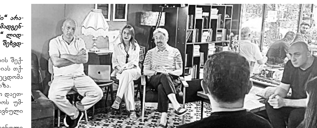
ამომრჩეველი მიიყვანოს საარჩევნო უზნებთან.

ბათუმში, „თავისუფალ სივრცეში“ არასამთავრობო ორგანიზაციების წარმომადგენლებს პოლიტიკურ პარტია „ახალის“ ლიდერები ნიკა მელია და ნიკა გვარამია შეხვდნენ