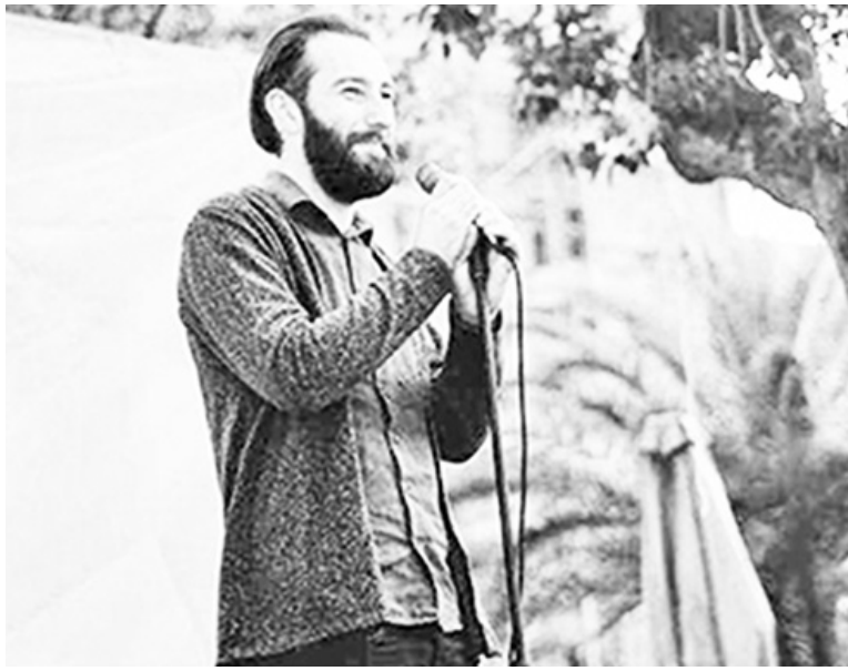
როგორც რუსეთში, გააქრონ საერთაშორისო პარტნიორები და ჩახსოვონ განსხვავებული აზრი. მოჰყავთ მაგალითები, თითქმის ჩვენს სხვადასხვა პარტნიორ ქვეყანაში მოქმედებს

საპარლამენტო არჩევნებამდე ხუთი თვე დარჩა და, ბუნებრივია, პოლიტიკური ატმოსფერო ძალიან დაძაბულია. ოპონენტები ერთმანეთისადმი ანტაგონისტურად არიან განწყობილი