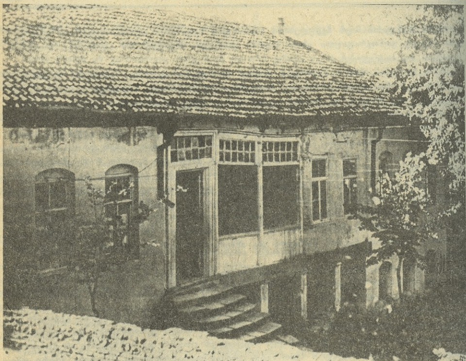
ილიასდროინდელი სასამართლო შენობა დუშეთში