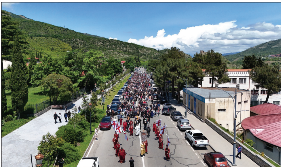
მსვლელობა ქ. მცხეთაში. 17 მაისი, 2024 წელი