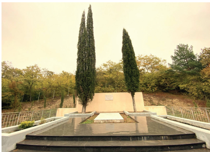
ილია წინამძღვრიშვილის რეაბილიტირებული განსასვენებელი