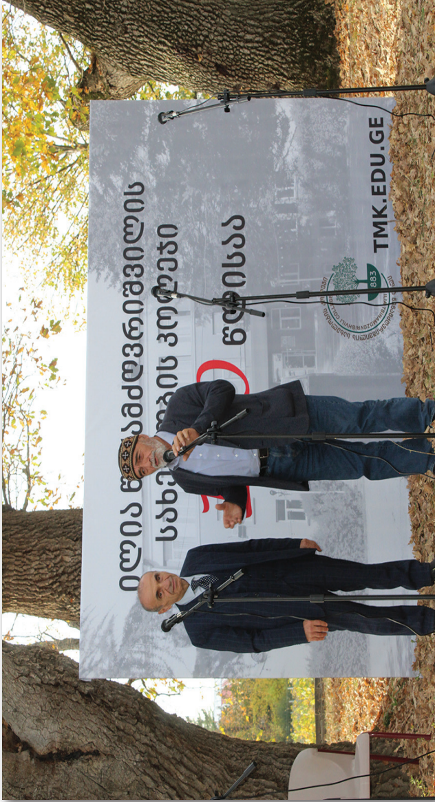
საპატიო სტუმარი, პოეტი ტარიელ ხარსელაური