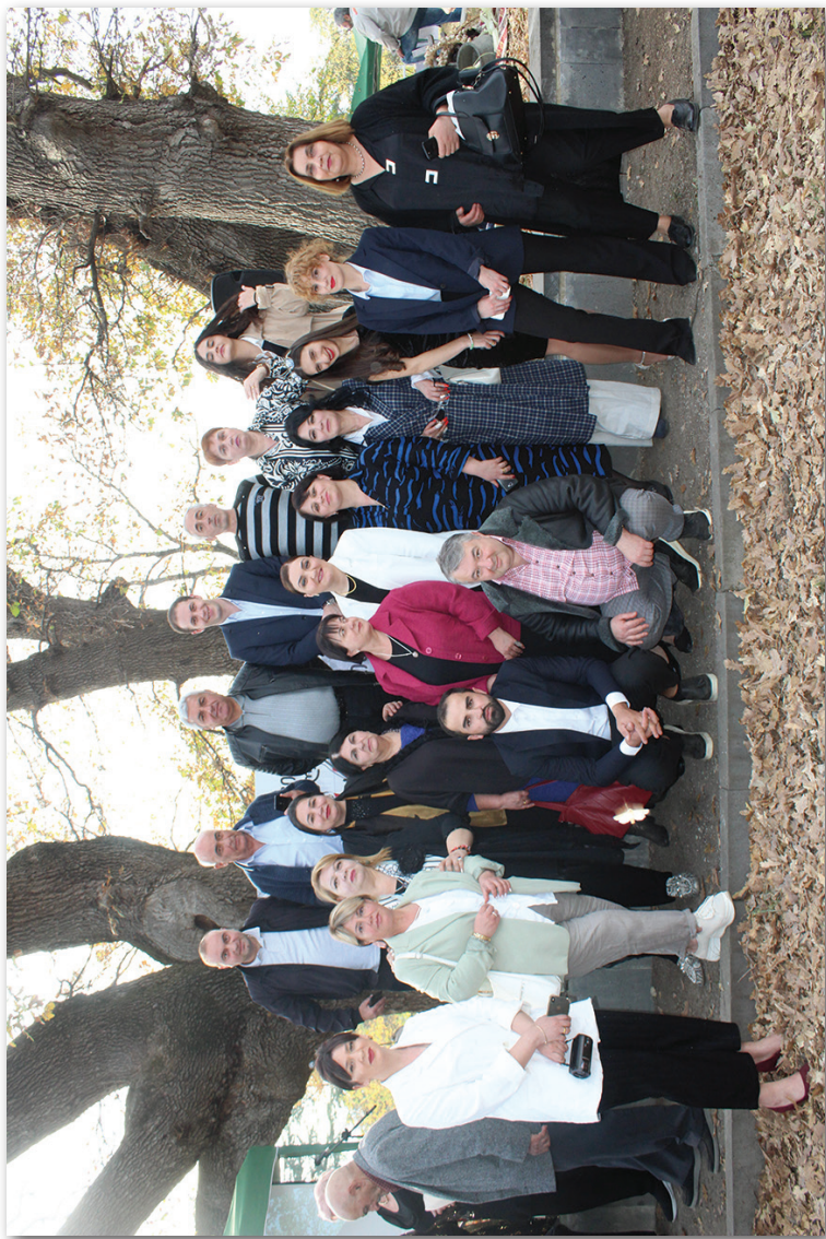
კოლეჯის ადმინისტრაციის წევრები და პედაგოგები