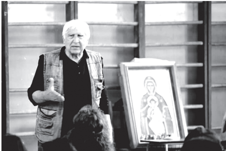
ინიციატივით. ღონისძიების ორგანიზატორი იყო ამავე სკოლის ქართული ენისა და ლიტერატურის კათედრა. ჩანახატები