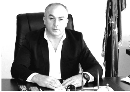
როსტომ მახრამაძე ასპინძის მუნიციპალიტეტის მერი

გილოცავთ, ჩვენი მეთორმეტეკლასელებო თქვენი ცხოვრების ერთ-ერთ უმნიშვნელოვანეს მოვლენას – სკოლის დასრულებას, ბოლო ზარს სკოლაში.