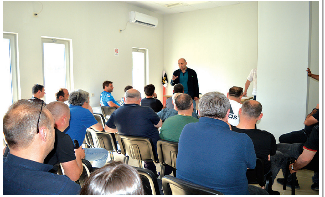
გულშემატკივრების სახელით, რომელიც ათასობითაა, ასევე, გვინდა, ჩვენც მაღლობა ვუთხრათ ამ საოცარ ხალხს, რომელთა ძალისხმევითაც „ივერია“ აუცილებლად გაბრწყინდება.

ხაშურში რომ უყვართ ფეხბურთი, ეს გულშემატკივართა სიმრავლითაც დასტურდება. დასწრების მხრივ, ამ სიმრავლით, თვით უმაღლესი ლიგის გუნდებსაც კი ვუსწრებთ. ეს სიყვარული, რა თქმა უნდა, მთელი მუნიციპალიტეტის მასშტაბით ვრცელდება და აი, კიდევ მორიგი დასტური ამ ფაქტისა: 5 მაისს, „ივერის“ სტადიონზე, შეიკრიბნენ ადგილობრივი ბიზნესმენები, რომელთაც გადაწყვიტეს, გვერდში დაუდგნენ ჩვენს საყვარელ გუნდს. ეს თანადგომა ნათელი მაგალითია იმისა, თუ როგორ უნდა ვემსახუროთ თითოეული ჩვენგანი ჩვენს მშობლიურ კუთხეს თუ ქალაქს და მთლიანად საქართველოს. შეხვედრაზე, რომელსაც უძღვევოდა მუნიციპალიტეტის მერი თენგიზ ჩიტიაშვილი, აღინიშნა, რომ ბიზნესმენების თანადგომა და ფინანსური მხარდაჭერა, იმედია გარანტი გახდება, რომ „ივერია“ ასეთივე წარმატებით ჩაამთავრებს სეზონს და მაღალ ჯგუფში დაწინაურდება. მერმა მაღლობა გადაუხადა ბიზნესმენებს ასეთი თანადგომისათვის.