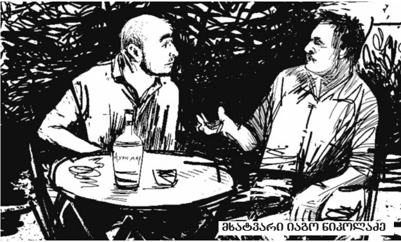
მხატვარი იანო ნიკოლაძე

— ზურაჯან, ქრისტე აღსდგა! — ჭეშმარიტად! — ის გინდა ვირთხა სად არის, სახში რო არალი? — თავი გადაიქნია ერვანდამ ნანულის სახლისკენ. — რა იყო, რო? — არაფელი, აი, ესენები უნა ვაჩუქო, პადარკები, რა! აი, ესა კიდე, კარებთან უნა დაურჭო! — ამოლაგა დახატული კვერცხები, გაფერადებული პასკები და რაღაც გადახვეული.