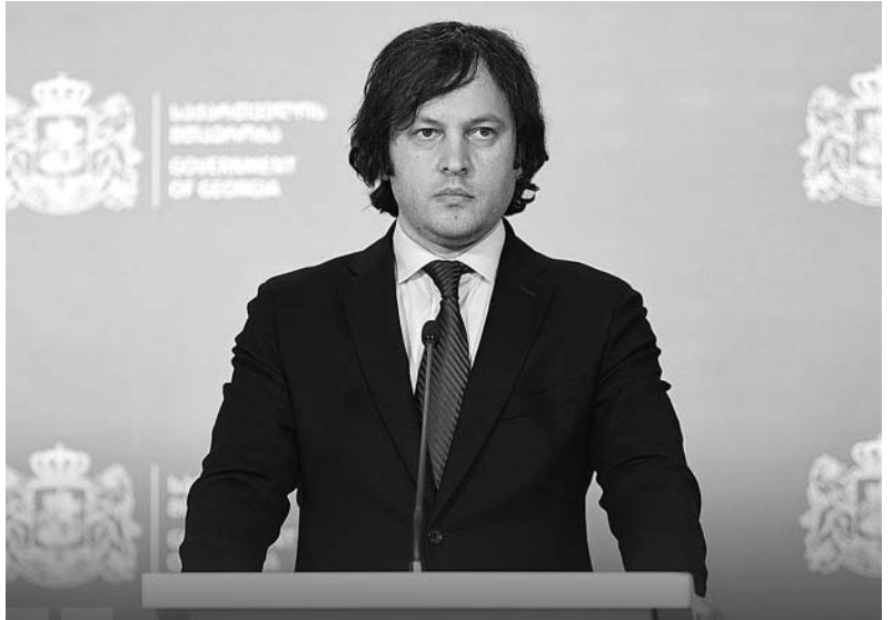
შეუძლებელია ასეთი მუშაობით დაგანტაჟდეს ხელისუფლება და მით უმეტეს ქართული საზოგადოება, ქართულ საზოგადოებას იმდენი რამ აქვს გამოვლილი გასული 30 წლის განმავლობაში, რომ მისი დაგანტაჟება არის აბსოლუტურად შეუძლებელი.

ირაკლი კობახიძე ჟიჟიანტას პავლიონის აქციაზე მისვლას ეხმაურება. საქართველოს პრემიერ-მინისტრი ირაკლი კობახიძე აცხადებს, რომ კონკრეტული ქვეყნის პარლამენტის წევრის, ჟიჟიანტას პავლიონის „გამჭვირვალობის შესახებ“ კანონპროექტის“ საწინააღმდეგო აქციაზე მისვლა საქართველოს სუვერენიტეტის მიმართ უხეში დამოკიდებულების გამოვლინებაა. „ჟიჟიანტას პავლიონის აქციაზე მისვლა არის, რა თქმა უნდა, იმის მაჩვენებელი, თუ როგორია ამ ადამიანების დამოკიდებულება სახელმწიფოსა და მისი სუვერენიტეტის მიმართ. ამდენი ხანი ჩვენ რასაც ვამტკიცებთ, იმის დასტური წარმოადგინა ბატონმა პავლიონისმა. ჩვენ ვამტკიცებთ, რომ ვიღაცებს არ მოსწონთ, გულზე არ ეხატებათ საქართველოს სუვერენიტეტი. როდესაც კადრულობს კონკრეტული ქვეყნის პარლამენტის წევრი, უცხო ქვეყნის წარმომადგენელი პოლიტიკოსი, რომ უხეშად ჩაერიოს ამ ქვეყნის შიდა პოლიტიკურ საქმეებში, ამით ხომ ამტკიცებს იმას, რასაც ჩვენ ვამტკიცებდით ამდენი ხნის განმავლობაში, რომ ეს არის მათი დამოკიდებულება, მაგრამ ჩვენ არ ვაპირებთ, ლოიალური დამოკიდებულება გამოვავლინოთ ასეთი ინციდენტების მიმართ, რაც უკავშირდება საქართველოს სუვერენიტეტის მიმართ უხეში დამოკიდებულების გამოვლინებას“, - განაცხადა კობახიძემ.