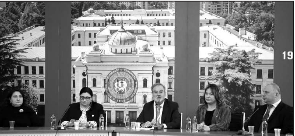
თსუ-ში ევროკავშირის დღეების ფარგლებში საქარო დისკუსიათა კვირული გაიხსნა