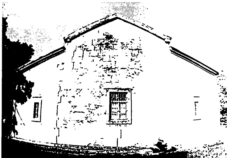
ხონის წმიდა გიორგის საყდარი. აღმოსავლეთი ფასადი, წარწერებიანი.