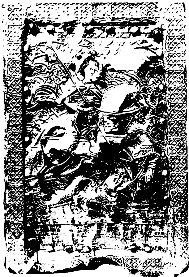
წმიდა გიორგის ხატი. 1636 წ.