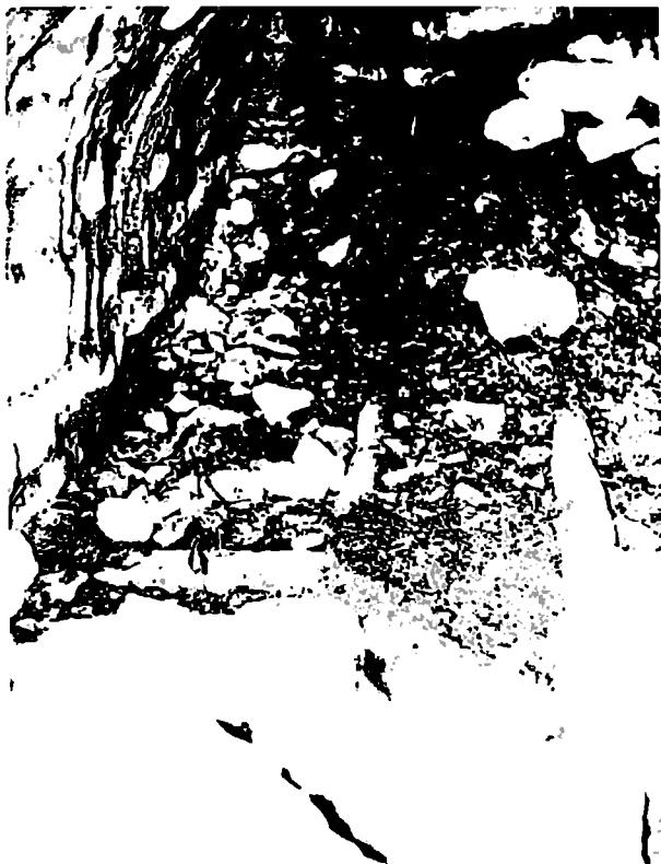
უძველესი კლდეში ნაკეთი სამარხები სოფელ კინჩხაში.