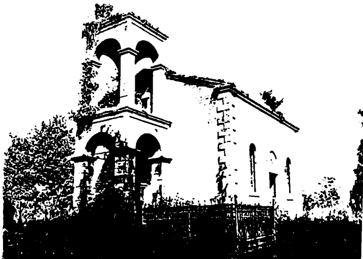
სოფელ პატარა ჟიხაიშის ეკლესია.