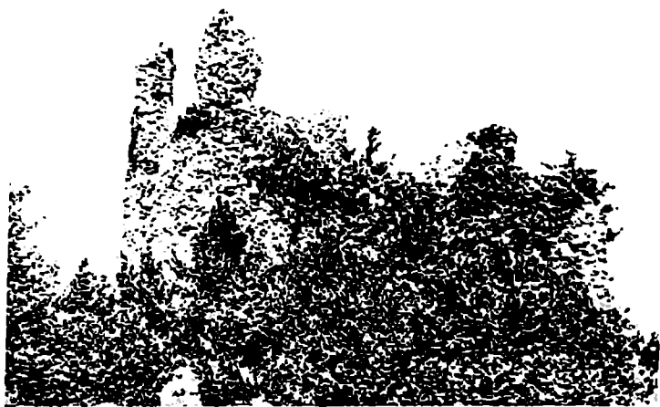
ნოლის ციხე (უკიმეროზი). VI ს.