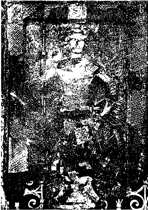
ზონის ეკლესიის წმიდა გიორგის ხატი. XIV ს.