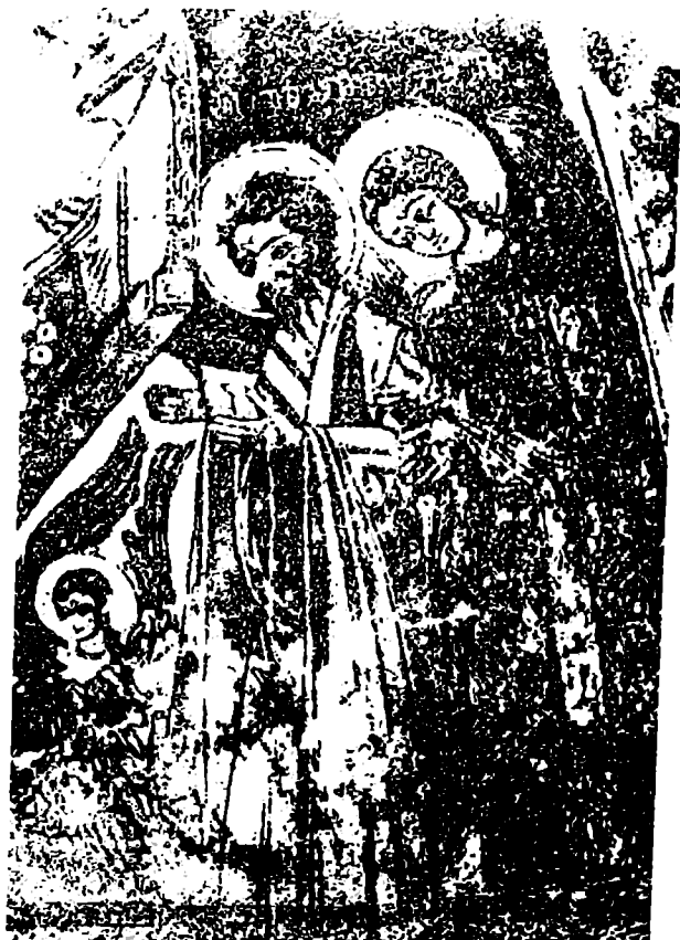
იოანე ნათლისმცემლის და გაბრიელ მთაწარანგელოზის ფრესკა (ვედრების დეტალი) ხონის საყდრიდან. XVII ს.