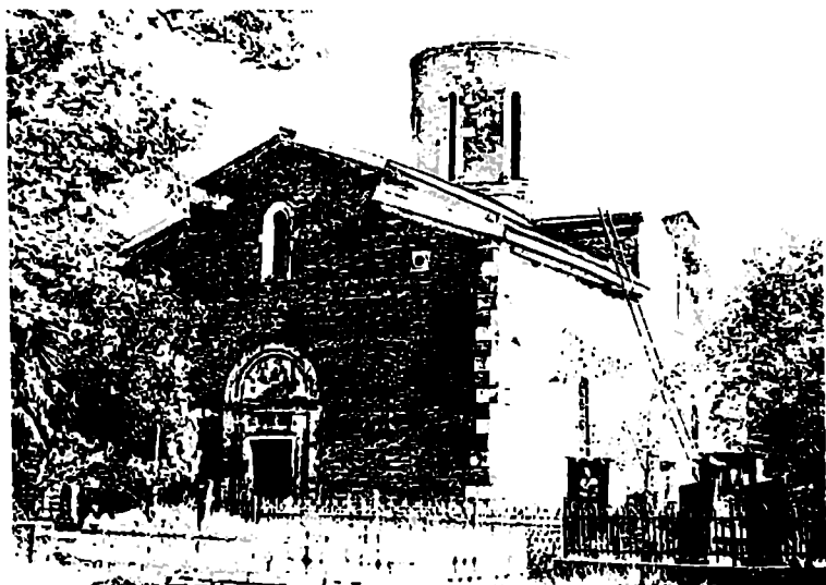
სოფელ ქუტირის ეკლესია.