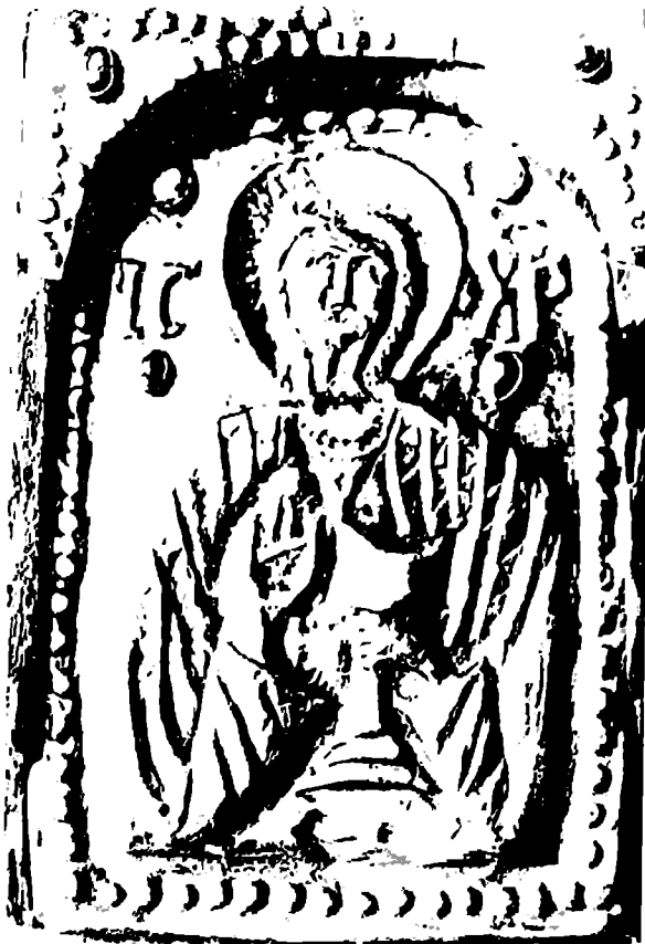
ხონი. მაცხოვრის ხატი (ანჩისხატი).