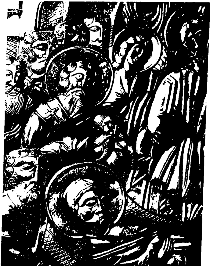
ღვთისმშობლის მიძინება. ანჩისხატის მაცხოვრის ხატის კარედის მოჭედულობის დეტალი. XVII ს.