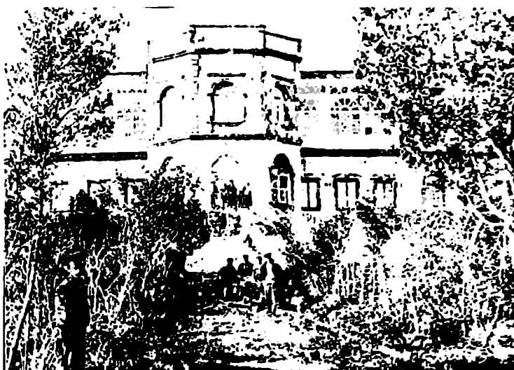
გორდი დადიანთა სასახლე. 1918 წლის ფოტო.