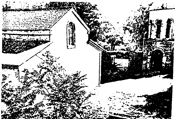
ხონის ტაძრის დასავლეთი ფასადი და სამრეკლო.