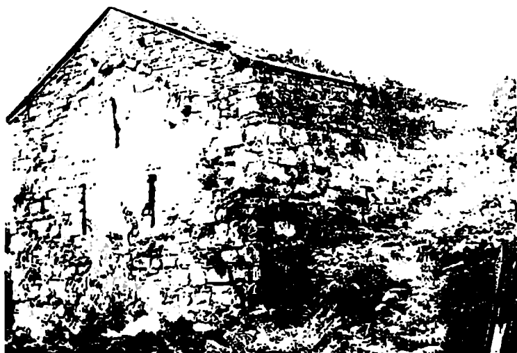
უძლოურის (ახალბედისეულთან) მაცხოვრის ამაღლების ეკლესია. XIX ს.