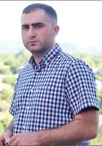
ათო, არის მომენტებიც, რომ ცხვება გაუფუფარი ცომის პური, ან ატკრეცილი და ცხობადუმათვრეველი, რაც ჩვენი მოსახლეობის უკმაყოფილებას იწვევს. თქვენი კომენტარო.