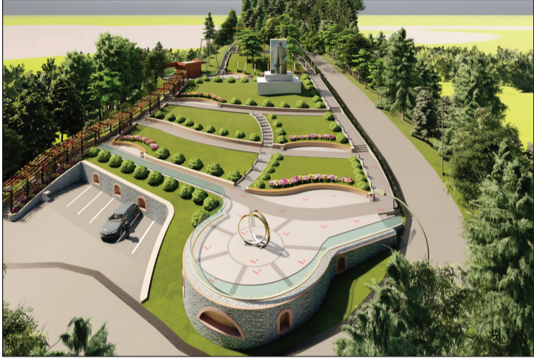
დასაწყისი 1-ელ გვ.-ზე

ხშირად უქმნიდა პრობლემას, რომელიც პროექტის განხორციელებით მოგვარდება აღნიშნული პრობლემა. პროექტის სახელმძღვანელო ღირებულება შეადგენს 180 ათას ლარს.