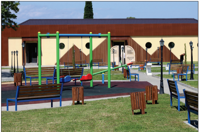
გაგრძელება მე-2 გვ.-ზე

რეგიონებში განსახორციელებელი პროექტების ფონდის დაფინანსებით განხორციელდა სოფელ გრემის სასმელი წყლის სათავე ნაგებობის რეაბილიტაცია, რის შედეგადაც, მთელ სოფელს, 24 საათის განმავლობაში მუდმივად მიეწოდება სასმელი წყალი. ამ პროექტის სახელმძღვანელო ღირებულებამ 188 041 ლარი შეადგინა;