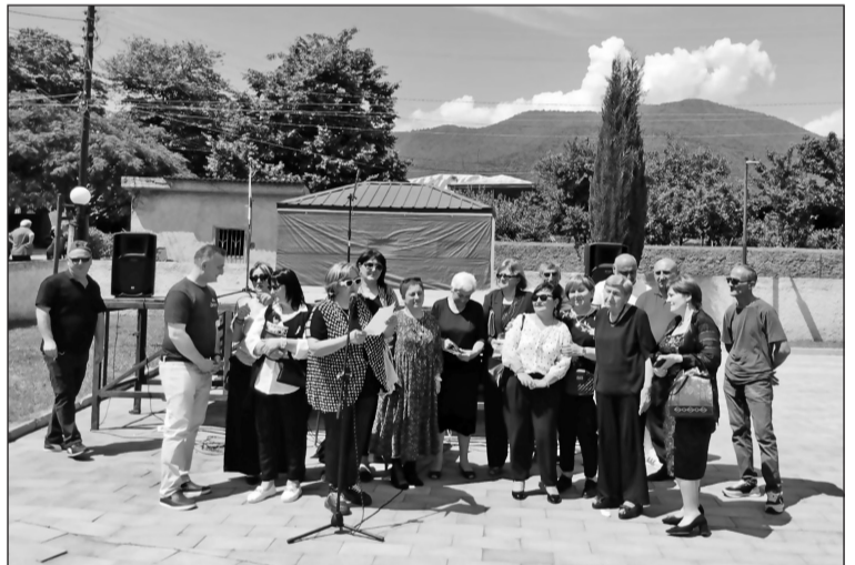
მოლაშქრის, ვინც იყო და არის ამ კლასის სათაყვანელები დამრგებელი მასწავლებელი.

მე როგორც ორგანიზაცია ბოგირის დირექტორს და ამ პროექტის ორგანიზატორს, ყველაზე დიდი პრივილეგია მერო წილად: ბოგირის მოსახლეობასთან თითქმის ყოველდღიური ურთიერთობა ამ სახალისო ღონისძიებისა და წინის