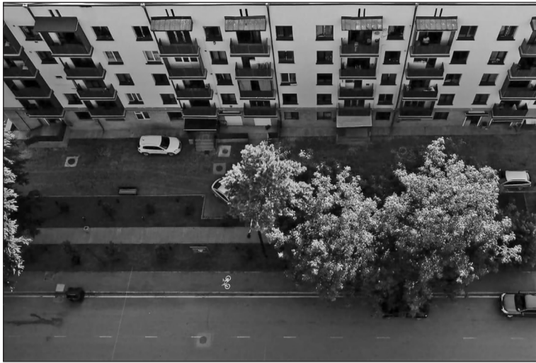
დასახეობა მე-2 გვ.-ზე

ლინდში ოთხჯერ ვეხმარებით, ასეთი 6 ბავშვია და გახარჯულია 4 800 ლარი.