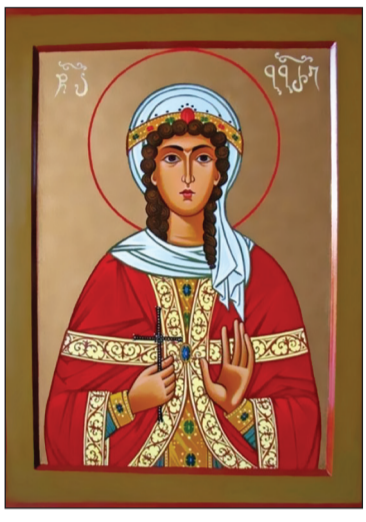
ფასი ჩასაცმელსა და მოსართავზე და საერთოდ მინიერ კეთილდღეობაზე. მაგრამ დიოსკორეს დიდად სურდა ქალიშვილის გათხოვება; ერთხელაც ამ

წმინდა ბარბარე დაიბადა 17 დეკემბერს (ძვ. სტ. 4 დეკემბერს) ფინიკიის ქალაქ ილიოპოლისში. მდიდარი, წარჩინებული გვარიშვილის ოჯახში. მისი მშობლები წარმართები იყვნენ და თავყვანს სცემდნენ კერპებს. ბარბარეს დედა ადრე გარდაიცვალა. იგი ოჯახის ერთადერთი შვილი და მამისაგან განეზივრებული იყო. ახალგაზრდა ბარბარე ისე დამშვენდა, ვერავინ შეედრებოდა სილამაზით. დიოსკორეს, მამამისს, მიანდა, რომ მდაბიო, უზნეო ადამიანები ღირსნი არ იყვნენ მისი ხილვისა, ამიტომ მალაღი კოშკი ააგო და გოგონა შიგ ჩაკეტა, მიუჩინა ერთგული მსახურები და მოახლეები.