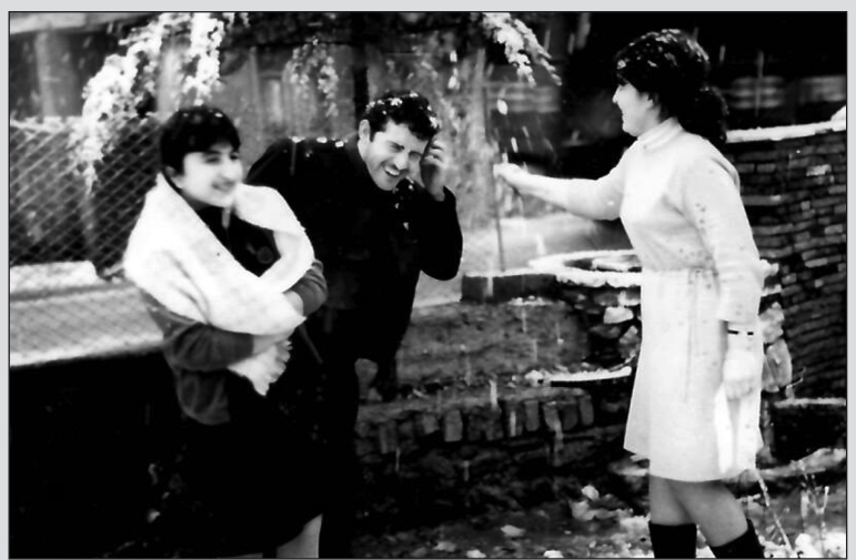
დასაწყისი მე-4 გვ.-ზე

ასე, რომ ყველას, მიუღ საზოგადოებას, გილოცავთ ჩვენი საყვარელი გაზეთის ოუბლივს და მოვიწოდებთ, ჩავდგეთ მის სამსახურში და ვიღვანოთ იმისათვის, რომ გაზეთი რეალურად ამართლებდეს თავის მისიას და დანიშნულებას!