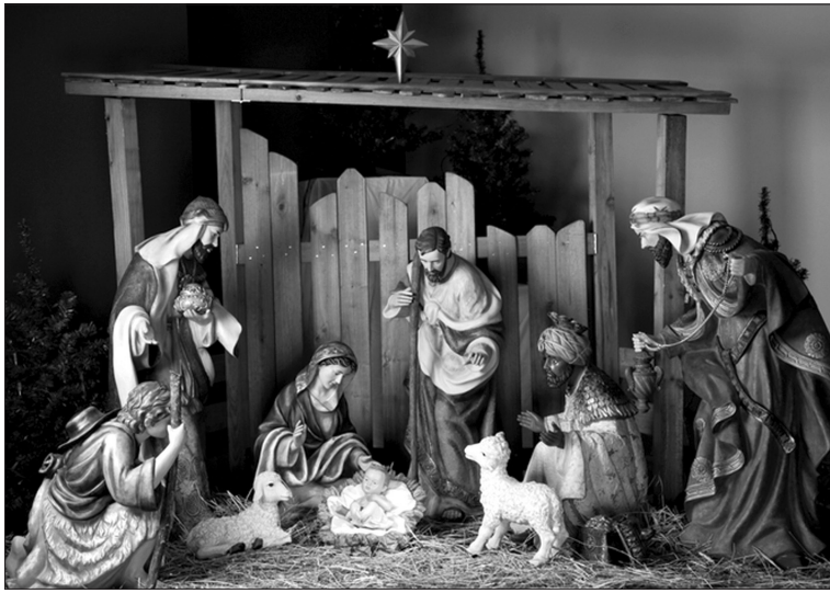
დასაწყისი 1-ელ გვ. -ზე

რამდენიმე ხნით ადრე ქრისტეს შობამდე ცაზე უჩვეულო ვარსკვლავი გამოჩნდა. სამი მოგვი, ყოველი თვის ქვეყნიდან გამოიყვანა ამ ვარსკვლავს პალესტინისაკენ. უჩვეულო ვარსკვლავი ბეთლემში თითქმის მიწამდე დაეშვა და ბოლოს იმ გამოქვაბულის თავზე გაჩერდა, სადაც ბავშვი ახალშობილი მაცხოვარი იწვა. იხილეს რა საქონლის ბავშვი შწოლარე ყრმა, აღმოსავლელი ბრძენი მიხედნენ, რომ ახალშობილის მუხუფზე ფუფუნებამი და დიდებულ დარბაზებში კი არა, სიღარიბეში, მორჩილებაში და ამქვეყნიური დიდების მოძულეებში იყო. წარმართ განსწავლულ ბრძენებს მათთვის მოულოდნელმა სახანაობამ არ იმოქმედა და ის რწმენა არ შერყევიათ, რის გამოც ასეთი გრძელი გზა გამოიარეს. პირიქით, შევიდნენ საქონლის სადგომში, მივახლნენ ბავშვი შწოლარე ყრმას და თავიანთ სცეს მას, არა მარტო როგორც მეფეს, არამედ როგორც ღმერთსაც და ძღვენიც მიართვეს: ოქრო, გუნდროკი და მური. ოქრო – როგორც მეფეს, გუნდროკი – როგორც ღმერთს და მური – როგორც კაცს, ვინაიდან მურს გარდაცვლილი ცხენების გასააბჯინებლად იყენებდნენ, რათა შენახულიყო იგი.