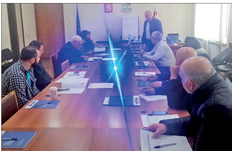
გაგრძელება მე-2 გვ. -ზე

ყველასათვის ცნობილია, რომ საქართველოს ორგანიზაციის კანონისა და საარჩევნო კოდექსის შესაბამისად მუნიციპალიტეტის მერს მოსახლეობის დიდი რაოდენობა (50 პროცენტზე მეტი) ირჩევს, შესაბამისად მისი პასუხისმგებლობა ამომრჩევლების წინაშე და მის მიმართ მოქალაქეთა მოთხოვნები გაცილებით მაღალია მუნიციპალიტეტის სხვა არჩეულ პირებთან შედარებით. მერს მრავალფუნქციური დატვირთვა აქვს – ხელმძღვანელობს მერიას და მუნიციპალურ სამსახურებს, იღებს გადაწყვეტილებებს მიმდინარე, საკადრო და მის უფლებამოსილებაში არსებულ სხვა საკითხებზე; გარდა ამისა, ის ამზადებს და წარუდგენს საკრებულოს ადმინისტრაციულ-სამართლებრივი აქტების პროექტებს, რომელთაგან ერთის – მუნიციპალიტეტის ბიუჯეტის პროექტის მომზადება და წარდგენა მისი ესკულუზური კომპეტენციაა.