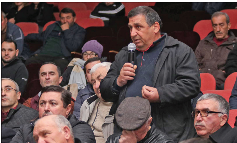
გაგრძელება მე-2 გვ. -ზე

და ასეულ მილიონობით ლარის შემოსავალი მიიღეს მევენახე ფერმერებმა. ასევე მნიშვნელოვანია, რომ სოფლის მეურნეობის დარგის პარალელურად წარმატებით ვითარდება ტურიზმი, რომელიც ამ სფეროში დასაქმებული ადამიანების შემოსავლებს მნიშვნელოვნად ზრდის. ტურიზმის განვითარება კი შესაბამისი ინფრასტრუქტურის გარეშე ვერ მოხდება, ამიტომაც სახელმწიფო ყოველწლიურად ზრდის დაფინანსებას ინფრასტრუქტურული პროექტების განსახორციელებლად და მომავალი წელი უფრო პერსპექტიულია ამ მიმართულებით. მაგრამ თუ არ შევიწარმუნებთ სტაბილურობას და მშვი-