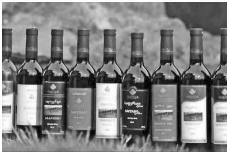
მეღვინეობის სექტორში, კახეთის მოსახლეობაში DCFTA-ის შესახებ ცნობიერების ამაღლება

პროექტის მიმდინარეობის პერიოდში იმუშავებს ცხელიხაზი, დამატებითი ინფორმაცია შეგროვება ტელეფონით 599 21 57 57 და ფეისბუქზე https://www.facebook.com/meRvine-qalTa-da-yurZnis-mesakuTretAsociacia-372470266189950/?ref=aymt-homepage-panel