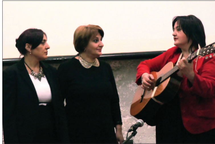
მადლობა უნდა მოუხადოთ კახეთის მხარეში სახელმწიფო რწმუნებულის ადმინისტრაციის მთავარ სპეციალისტს, მწერალთა კავშირის წევრს, ლირსების

თელავიდან მოწვეულმა ბავშვთა ანსამბლების, ფოლკლორული ანსამბლის „ხეურის“ და ტრიო „თოლას“ მიერ შესრულებულმა სიმღერებმა სტუმრები აღაფრთოვანა და მჭუხარე ტაშით უხდიდნენ მადლობას.