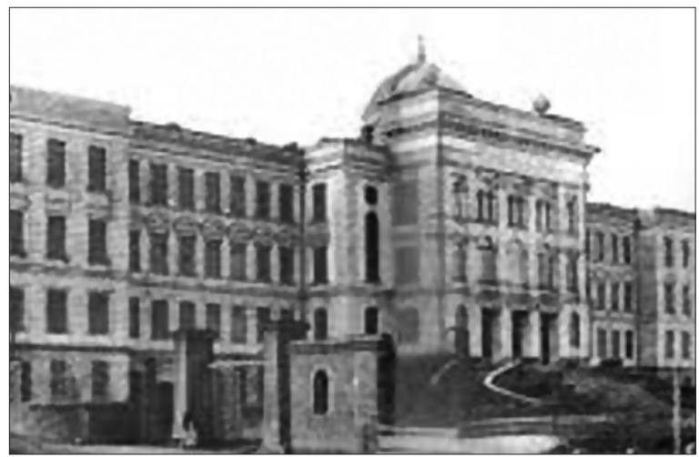
უმაღლესი სასწავლებლის გახსნისათვის მზადება.

ხელისუფლების სახელით უნივერსიტეტის გახსნას შეეშალა საქართველოს ეროვნული საბჭოს აღმასრულებელი კომიტეტის წევრი, უნივერსიტეტის დამფუძნებელი საზოგადოების თავჯდომარე აკაკი ჩხენკელი, რომელიც ამ დღეს, უკვე ემიგრაციაში მყოფი, ასე იხსენებს: „ჩემთვის ძნელია მოგონება, რა ვთქვი იმ დღეს თავჯდომარის საკარძიდან. მასსოვს მხოლოდ არაჩვეულებრივი მელღვარება, დამსწრეთა სახეზედ, დიდი იყო მათი რიცხვი, ხალხს ვერ იტყვია საზეიმო დარბაზი, ვერც განიერი დერეფნები, თვით ეზოში ბევრი კანკალებდა სიცივისგან. ამოღენ უადგილობრივი განამებულ ხალხს სხვა არ დარჩენოდა რა, გარდა იმისა, რომ ბანი დაენია დარბაზიდან მიღებულ ვაშა-ტაშისათვის. საყურადღებოა, რომ, გარდა მოსწავლე ახალგაზრდობისა, ბლომით იყო მდაბიო ხალხი: მუშა, ხელოვანი, ვაჭარი... უკანასკნელი სჭარბობდნენ კიდევ პირველი, რაც შეეხება მათი სიტყვიერ და საზოგადო მოღვაწეობა, პოეზიის არ სჩანდნენ ოფიციალური პირობი. აღსანიშნავია მხოლოდ ჩვენი მეზობლების დღეგაცვიები, რომელთაც მოსალოცი სიტყვები წარმოთქვამდნენ“ (წერს ივანე ჯავახიშვილი).