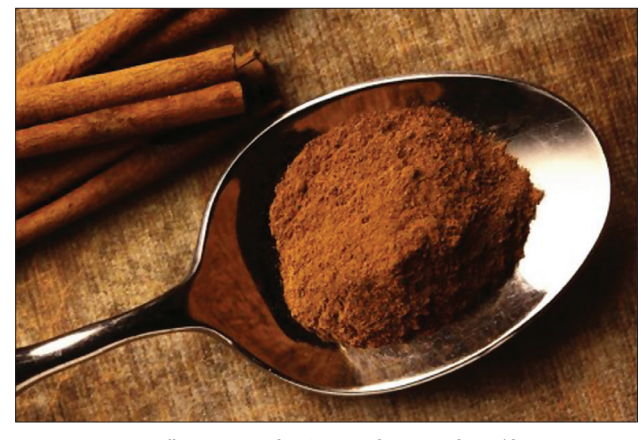
თქვენ ასევე შეგიძლიათ ჩაუმატოთ ჩ/კ დარიჩინი 1ჩ/კ თაფლს და ასე მიირთვათ.

როგორ მივიღოთ ყოველდღიურად: ყოველ დღით 1 ჩ/კ დარიჩინის ფხვნილი ჩაუმატეთ ფინჯან ყავას, ჩაის, რძეს, ლიმონის ან სხვა რომელიმე ხილის წვენს და მიირთვიეთ.