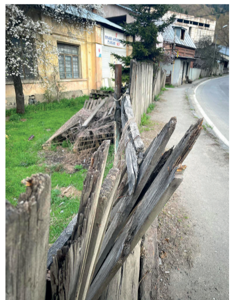
უაპროფიტო მხოვრავალი დოვა

რიტორიას და ხელმარჯვნივ რკინის მიჭექქცილ მოაჯირს დაინახავ, ადგილობრივები რომ ნუხან, - უშედეგოდ ვითხოვთ ახალ მოაჯირსო. მარცხნივ ხის ნახევრად წაქცეულ ღობეს მიეტაკებით, მეჩხერი კბილებით გადახნიელი-გადატეხილი, ჰა-ჰა, ჩაჩოქოს ბოლომდე „მაგდანას ლურჯასავით“ და დანებდეს? კიდევ ცოტახანს იჭიდაოს გამძლეობაზე?! ეს ღობე ყოფილი საბავშვო ბაღის (დიდი ხნის გამოკეტილის) დარაჯია. განა რა ფინანსები დაჭირდება მის მოშლასა და ახალი ღობის გავლებას?!.. ისეც ვინრო, საცაღფეხო ბილიკს მანდვე, ეს ღობე კიდევ უფრო ტრაგიკულს ხდის... ეს ქუჩა ძალიან შემეცოდა... მეერ ირონიულად გამკრა მეჩხერმა ღიმილმა და თვალმა მის ჩაყოლებასა თუ მოპირდაპირედ ერთი-ორი მესაკუთრის მიერ მიტოვებული სახლი და ფართი გამოაკონტურა. ქალაქის დამახინჯებული იერსახე-