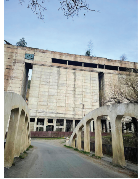
ელევატორი დაგრავის პირასა

გაუწყვთ ამ გზასაც და... როგორც ყველა გზა - „ეს გზაც ტაძრამდე მიგვიყვანს“. ტაძრის მოპირდაპირედ ყოფილი შუშის ქარხნის უზარმაზარი ტერიტორიაა, ამჟამინდელი ტრაილერთადაგომი, რომელიც ავტო-სასაფლაოს უფრო ნაავგავს, მესაფლავე რომ მიატოვებს... აქ, ნორმალური პარკინგი ხომ ფუფუნებაა. მძლოლებს არანაირი ხელშეწყობა და პირობები არ აქვთ, არც სასტუმრო-მოსასვენებელი, არც კაფე ან სწრაფი კვების ობიექტი - ნასახმესებელი. არადა ჩარხისწყლიდან იწყება ბაკურიანში მიმავალი გზა და ამ საავტომობილო გზაზე დადიან უცხოელი ტურისტები, ზამთარში მო-