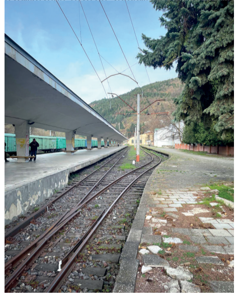
დანახიანებული მგზავრთა მოსაცდელი

ბოლო ათწლეულების განმავლობაში ჩვენს ქალაქში ვიხილეთ ბევრი წარუმატებელი ბიზნეს-ნამოსწყება თუ სახელმწიფო ნილობრივი მონაწილეობით დაფუძნებული სანარმოო წამოწყება-მეჩრება და ამით კულტურული გარემოს ვიზუალური მთლიანობის რღვევა... ერთ-ერთი ასეთი ობიექტია ყოფილი ნისქელიქარხნის ელევატორი, რომელიც გამოვიგნულია და ეს ათსართულიანი შენობა როდის ჩამოშლება არავინ იცის, რომლის სიღრმეშიც ალბათ, ქვეწარმავლებთან და მღრნელებთან ერთად მოჩვენებებიც სახლობენ (ეს ხუმრობით) თავად უსიცოცხლოს სახურავის თავი ამოსული ხეებზე დაუ-