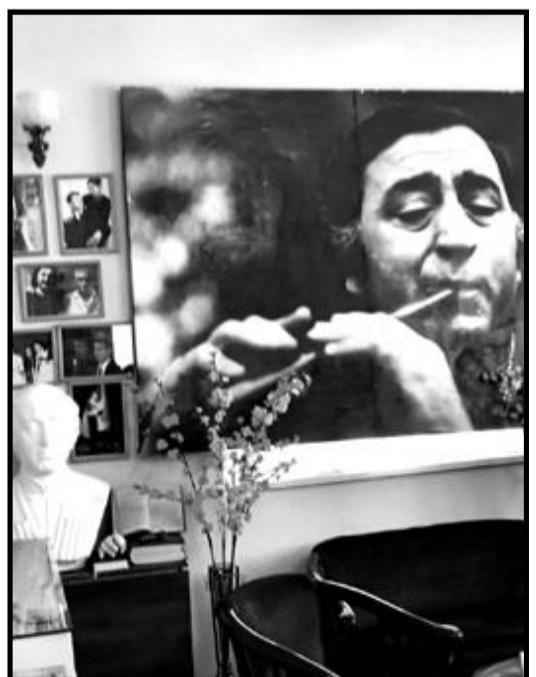
კასპის მუნიციპალიტეტის ბიბლიოთეკებისა და მუზეუმების გაერთიანება.

... იმდღევანდელი კავთისხევის დღე დასრულებითაც ნიშანდობლივი შესტი დასრულდა: სტუმართა ერთ ჯგუფს საჩუქრად გადაეცა ომარ კელაპატრიშვილის დაბადების 80-წლისთავთან დაკავშირებით გამოცემული წიგნი: „ქართული საღამურით დაპყრობილი მსოფლიო (ომარ კელაპატრიშვილი)“, ხოლო ყველა მონაწილე მოსწავლე დაჯილდოვდა სიგელებით.