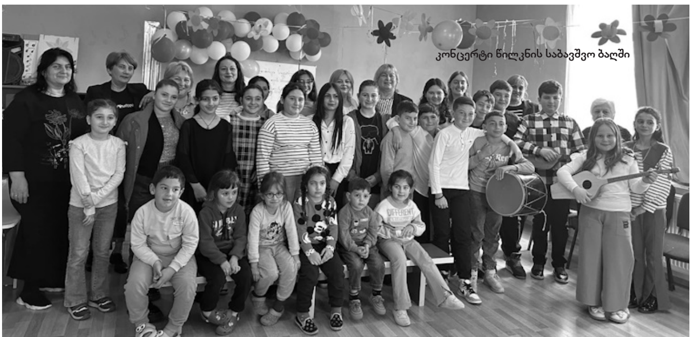
კონცერტი წილკნის საბავშვო ბაღში

ახალ, თანამედროვე ინსტრუმენტთან მუშაობა, მეცადინეობა, თუნდაც მუსიკის მოსმენა, გამოცდა, დახურული ან ღია კონცერტი მოსწავლეებს და მასწავლებლებსაც მოტივაციას გვიმაღლებს, სასწავლო