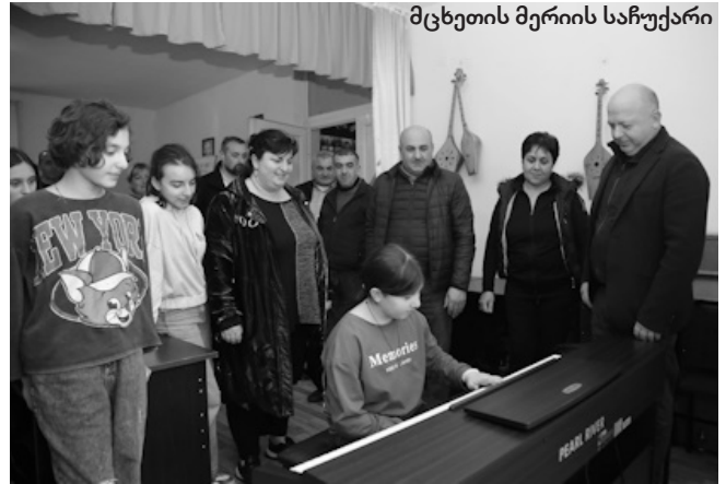
მცხეთის მერიის საჩუქარი

ისტორიული განვითარების კვალდაკვალ, როგორც ამბობენ, ყოველი სიახლე, დავინწყებული ძველია... თუ გავიხსენებთ ანტიკურ პერიოდს, მაგალითად, საბერძნეთში მუსიკის მოსმენას სამკურნალო ფუნქციაც კი ჰქონდა. სხვადასხვა დროს არსებობდა შრომის სიმღერები, რომელიც პულსს აძლიერებდა. არსებობს სამგლოვიარო მუსიკა, რომელიც ჭირისუფალთა განწყობას გამოხატავს და ასე შემდეგ. რაც შეეხება კლასიკურ მუსიკას, როგორც გითხარით, ის ყველგან და ყველაფერშია. გინახავთ ფილმი კლასიკური მუსიკის გარეშე? ეპიზოდის ხასიათს ზოგჯერ მუსიკა განსაზღვრავს, რაც მაყურებელში ემოციას იწვევს, ან ცეკვა, თუნდაც ფოლკლორული, ეროვნული, ქართუ-