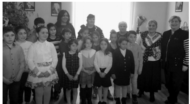
პირველკლასელთა ღია კონცერტი

სკოლის ადმინისტრაცია ვცდილობთ, მუსიკალურ განათლებასთან ერთად ჩვენს ბავშვებს ზოგადი წარმოდგენა ჰქონდეთ მუსიკალურ ან ჩვეულებრივ თეატრებზე. ამ მიზნით ვიყავით მოზარდ მაყურებელ-