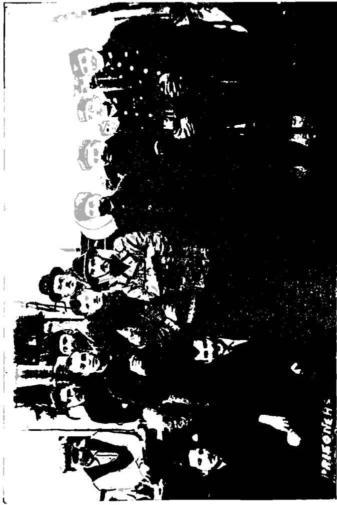
ანგლისელი იუდასტანის შიკადამბრისტიკის მემკვიდრეები, რომლებიც გარდაცემულნი არიან.