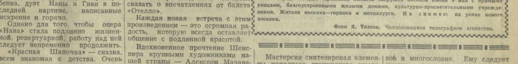
В Чехословацкой Республике вокруг крупных предприятий выросли новые поселки. Около города Кладно Пражской области сооружен поселок имени 9 мая свымирами, благоустроенными жилыми домами, культурно-просветительными учреждениями. Жители поселка — горняки и металлурги. На снимке: на улице нового поселка.