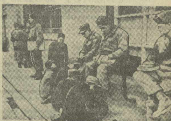
В Южной Корее сотни тысяч сирот в городах и селах страны являются беспризорными. На снимке: беспризорники чистят обувь американским солдатам на улицах Сеула.

По сообщению корреспондента агентства ДПА из Эль-Пасо (США), в результате поездки боннского министра обороны Штрауса по предприятиям и военным базам в США определены дальнейшие конкретные планы оснащения западногерманского флота ракетным оружием. Намечено, в частности, вооружить западногерманский флот американской ракетой типа «Тартар» и сухопутные войска — ракетой типа «Ред ай».