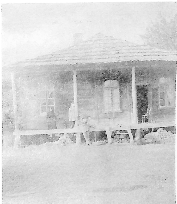
ნოეს ძეგლი ხანლი ღანჩსეიმი.