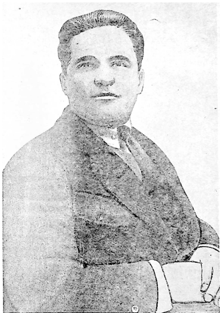
ს. მ. კიროვი საქართველოში 1920 წელს.