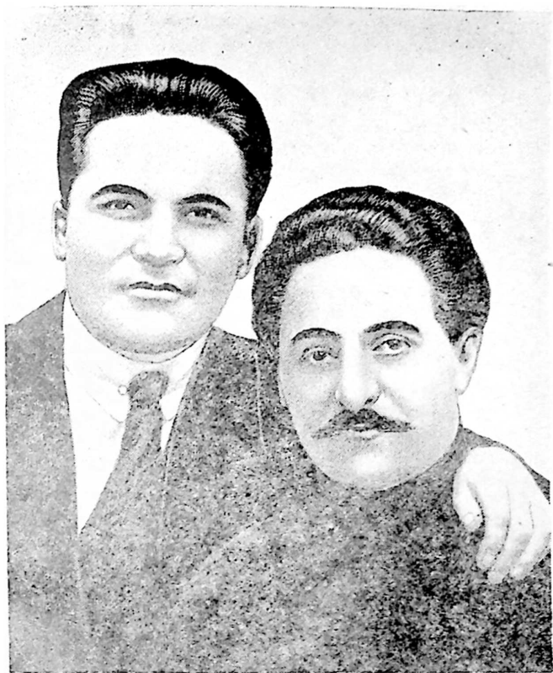
ს. მ. კიროვი და ს. ორჯონიკიძე ჩრდილოეთ კავკასიაში 1920 წ.