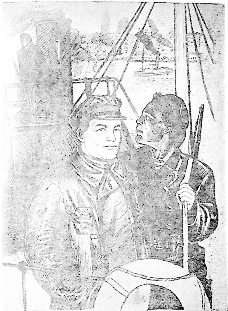
კიროვი ასტრახანის ფლოტილის მემღებურებს შორის 1919 წელს. ს. შაჩალოვის გრავეურა ხეზე.