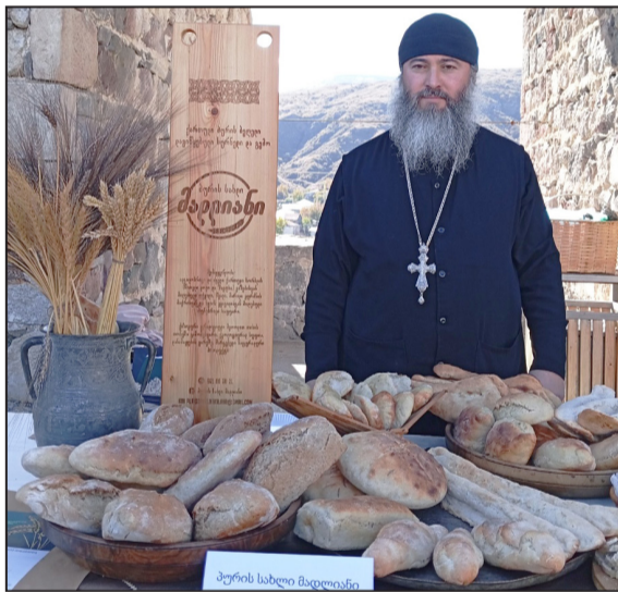
პურის სახლი მაღლიანი

გრილ ადგილას შეინახავდნენ. რამდენიმე დღის შემდეგ შეათბობდნენ და თბილ წყალთან ერთად შეაზელდნენ საპურე ფეკილს. ბოლოს თბილად შეფუთავდნენ და აფუებდნენ დაელოდებოდნენ. ამასობაში პაპა თონეს გაახურებდა და იწყებოდა შოთის პურების თონეში ჩაკვრა. დილით ბავშვებს ისეთი თონის პურის სურნელი გვავლიძებდა, ლოგინში ვეღარ ვჩერებოდით. სოფელში ყველამ იცოდა, იმ დღეს ვინ აცხობდა პურს, რადგან სუნი შორს ვრცელდებოდა. მიუხედავად იმისა, რომ მამინ ნაკლებად ეკლესიურად ცხოვრობდნენ, მოზელის შემდეგ ცომზე ხელით ჯვარს აუცილებლად გამოსახავდნენ. სანამ გამოცხვარ პურს სახლში დააბინავებდნენ, 10-15 პურს მეზობლებში გასცემდნენ. ამ საქმეს ხშირად ბავშვებს გვანდობდნენ და ჩვენც ხალისიანად ვარიგებდით. სხვებზეც ასე იქცეოდნენ და ერთმანეთს ხელს უმართავდნენ.