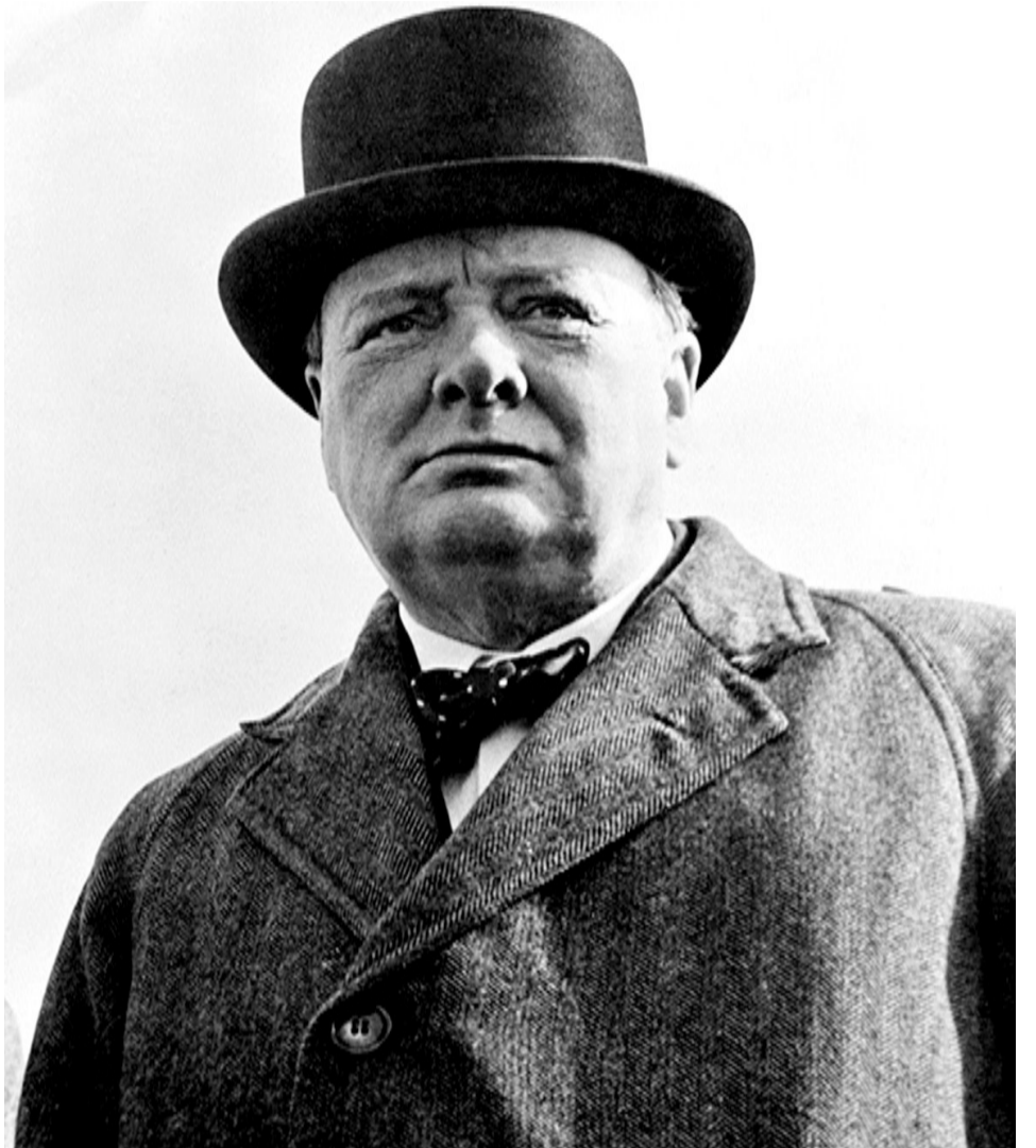
ტია(ახლანდელი გაგებით) ვერ უზრუნველყოფს მას.

აი, ამ აზრებს აღუძრავს "დემოკრატიული თავისუფლება" კაცობრიობის იმ ნაწილს, რომელსაც ღვთის მონიჭებული შემეცნების უნარის მწვავე დეფიციტი აქვს, ასეთები კი დიდი უმრავლესობაა ნებისმიერ საზოგადოებაში. სწორედ მათი ინტელექტის მართვისა და მოწესრიგების აუცილებლობის გამო შეიქმნა სახელმწიფო, რომლის ფუნქციაა მორალური კოდექსისა და სამართლებრივი ნორმების ჩარჩოებში მოაქციოს საზოგადოების უჭკუო და ჭკვიანი ნაწილი, რათა ყველა ადამიანმა იგრძნოს ნამდვილი პიროვნული თავისუფლება და საკუთარი ღირსების გრძობა. მრავალი საუკუნეების წინ მიაკვლია კაცობრიობამ იმ ჭკმმართველს, რომ თავისუფლება არის ობიექტური აუცილებლობა მოთხოვნისადმი დამორჩილება. აი, დემოკრა-