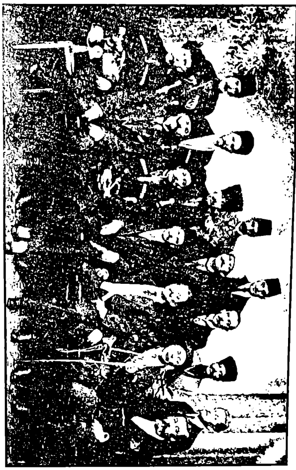
Խոյճ, 18-օրվային ցածր օրվային կոլեկտիվում