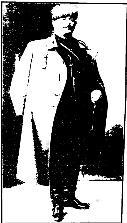
სურ. 16. საქართველოს რესპუბლიკის გენერალი ასლან აბაშიძე