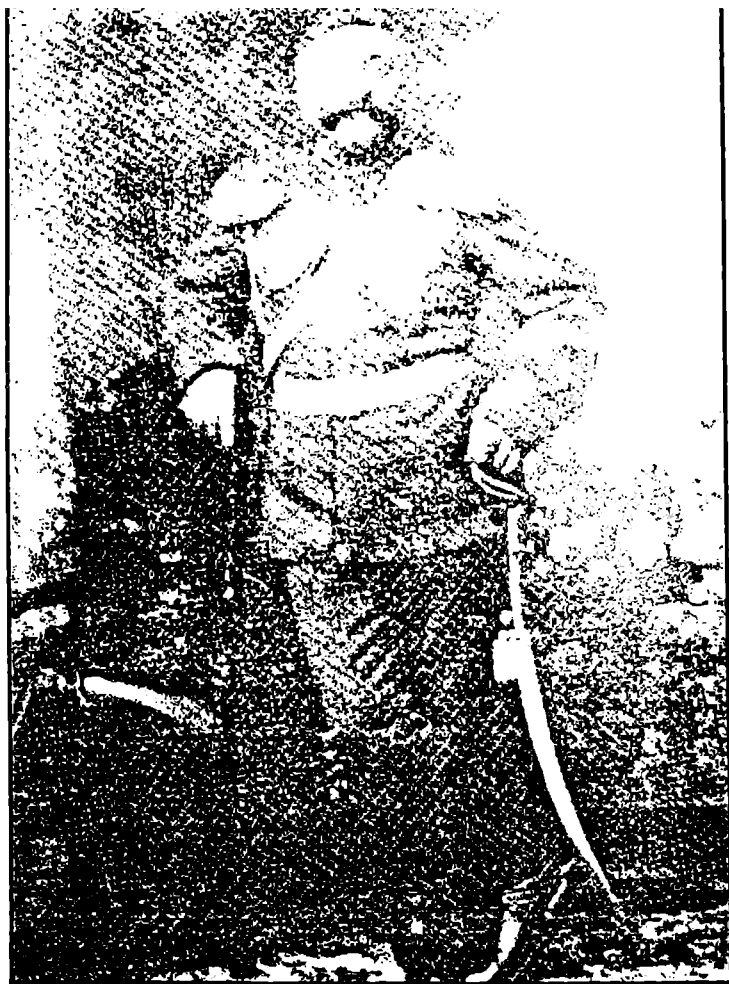
სურ. 5. ჯემალ ფაშა ხიმსიანსკელი