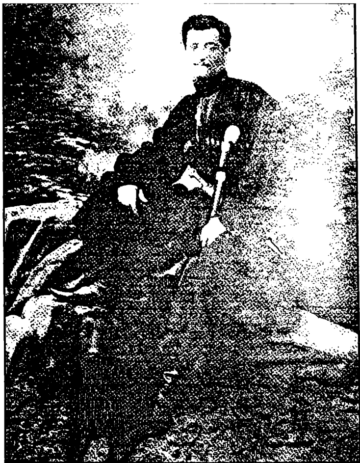
სურ. 13. ალვან ბეგ აბაშიძე