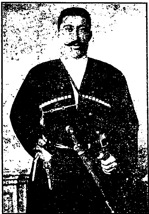
სურ. 11. ფოცხოვის სანჯაყ ბეგი