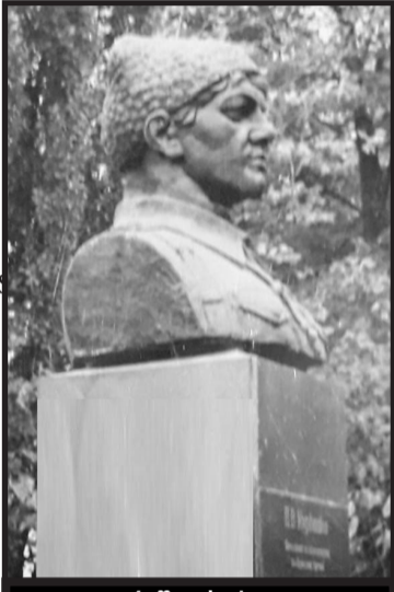
კურიშკოს ძეგლი ქალაქ ნითელწყაროში, დღევანდელი ღვთისმშობლის ტაძრის ადგილზე.