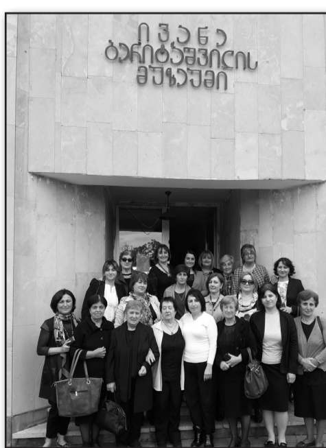
13 მაისს გურჯაანის რაიონის სოფელ ვევიზში საკვირა სკოლის ხელი შეუწყოს კახეთის რეგიონის