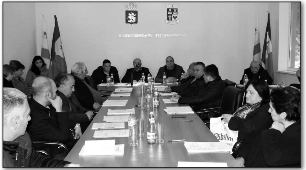
ჩვენი ბიუჯეტი, ისედაც სოციალურად ორიენტირებულია, ყოველწლიურად ვცდილობთ, გავზარდოთ სოციალური პაკეტი. თვალსაჩინოებისათვის შეგახანებთ, რომ ცოტა ხნის წინ, სოციალური პაკეტი კვლავ გაიზარდა 20 000 ლარით, ასევე დედოფლისწყაროში ლიდერია მთელი კახეთის მასშტაბით სათნოების სახლის დაფინანსების კუთხით... ზოლო წლებში მნიშვნელოვნად გაიზარდა ბავშვთა და სოციალურად დაუცველთა ჯანდაცვის ხარჯები, სოციალურ პაკეტს დამატა

მის შენიშვნას თავისი არგუმენტი დაუპირისპირა დედოფლისწყაროს მუნიციპალიტეტის მერმა და ბრალდება გააქარწყლა: „ჩვენი მუნიციპალიტეტის სპეციფიკურობიდან გამომდინარე, მინაზე ქონების გადასახადი, რომელიც ადგი-