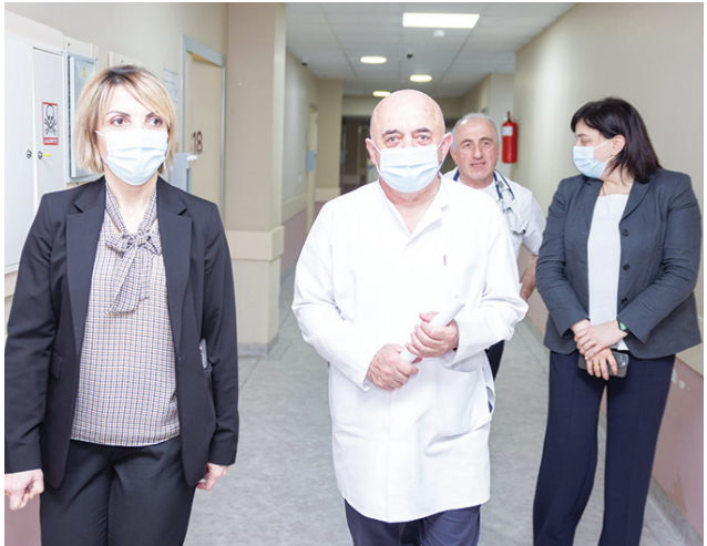
ვიზიტის ფარგლებში მინისტრი პედატრიულ განყოფილებაში არსებულ სამედიცინო სერვისებს გაეცნო. ჩვენი შეხვედრების მიზანია როგორც სამინისტროს პრო-

კლინიკა ჩართულია სამინისტროს შემდეგ პროგრამებში - ავთვისებიანი სიმსივნით დაავადებულ პაციენტთა დამატებითი სამედიცინო მომსახურება, სახსრების ენდოპროთეზირება, ინდივიდუალური სამედიცინო დახმარება, ზოგიერთი სოციალური კატეგორიის მოსახლეობის სამედიცინო მომსახურების თანადაფინანსება და ამბულატორიული მალტექნოლოგიური დიაგნოსტიკური კვლევები.